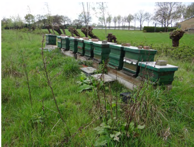
Figuur 1. Bijenkasten.

Onderzoek in Parijs (Ropars et al. 2019) toont een negatief effect van honingbijen (6,5 volk per km 2 ) op wilde bijen. Aangezien de afname van het aantal bestuivers steeds vaker wordt gemeld uit natuurlijke en agrarische omgevingen, worden steden gezien als plaatsen waar bestuivers vanwege de lage blootstelling aan pesticiden en de grote diversiteit aan bloemen gedurende het hele jaar noch wel kunnen overleven. Dit heeft geleid tot de ontwikkeling van beleid om bestuivers in stedelijke gebieden te ondersteunen. Dit beleid is echter te vaak beperkt tot maatregelen gericht op het bevorderen van de omstandigheden voor honingbijen, wat resulteerde in een sterke toename van het aantal bijenstallen in steden. Uit dit onderzoek blijkt dat in de stad Parijs de aantallen bloembezoeken van wilde bestuivers negatief gecorreleerd is met de dichtheid aan honingbijen-kolonies in de