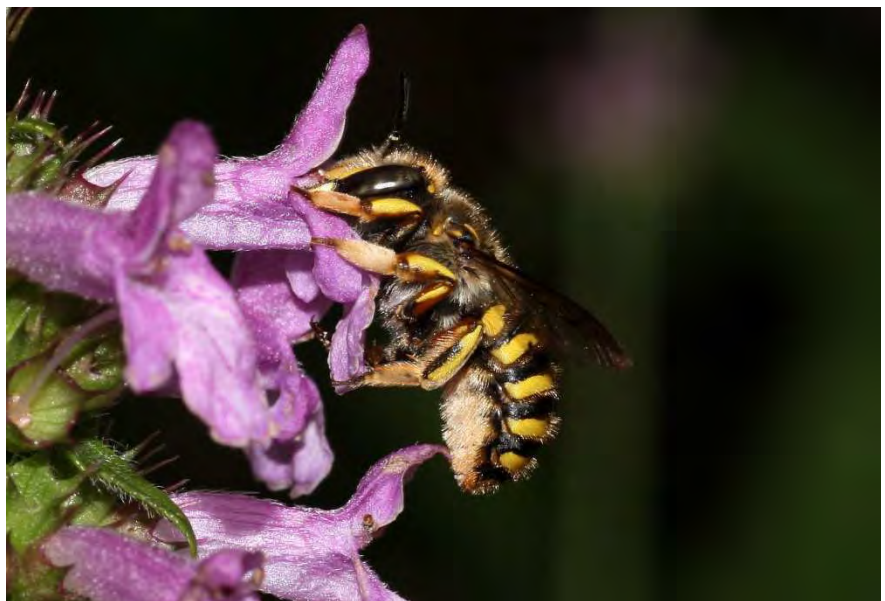
Figuur 2. Grote wolbij leeft graag in tuinen waar harige planten groeien. Met de haren daarvan bekleeden ze het nest.

varieert tussen wilde bijensoorten. Deze hypothesen zijn getest met een gegevensset van wilde bijenmonsters verzameld met kleurvalen op 25 stedelijke locaties in 2012 en 2013. Onderzocht zijn gemeenschaps- en populatiepatronen waarbij rekening is gehouden met de kans op onvolmaakte detectie. Er is geen bewijs van concurrentie tussen wilde en gedomesticeerde bijen bij een dichtheid aan volken honingbijen van 0,32-0,48 volk per km 2 . De analyses wijzen op gemengde effecten van stedelijke hitteïlanden op soorten en positieve effecten van meer bloemaanbod. Geconcludeerd wordt dat in steden co-existentie van stedelijke imkerij en wilde bijen mogelijk is bij gematigde dichtheden aan geplaatste honingbijenvolken. Het blijft echter cruciaal om de competitieve interacties tussen wilde en honingbijen