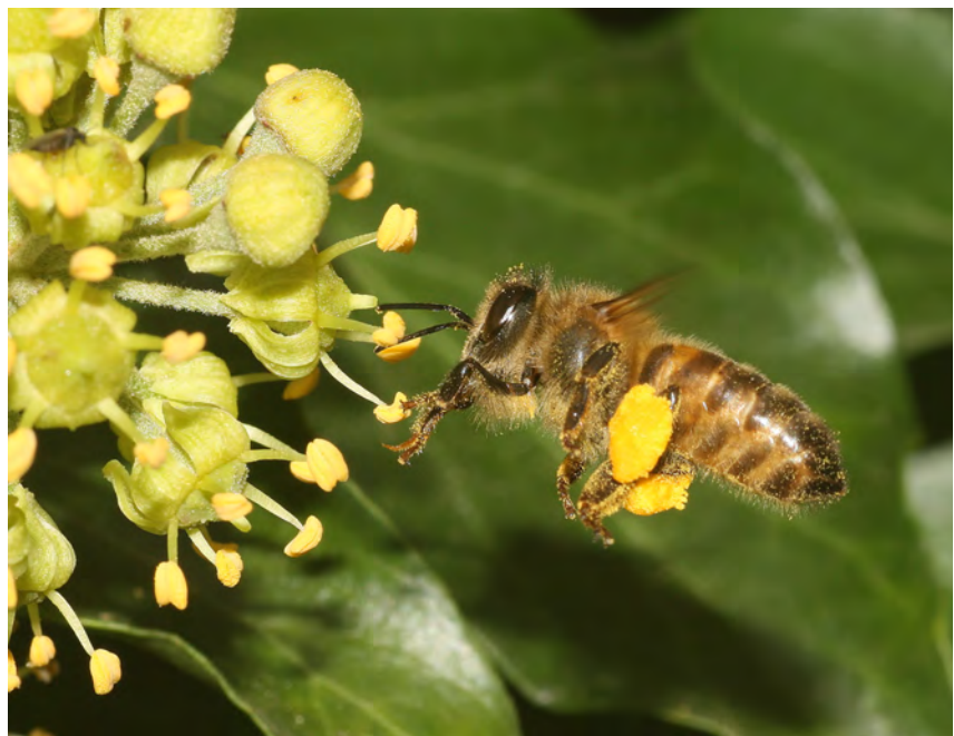
Figuur 4. Honingbij, werkster.

De gemeente Eindhoven heeft bufferzones van 500 meter rond waardevolle en potentierijke terreindelen of vindplaatsen van bijzondere bijen uitgezet, waarbinnen de gemeente geen toestemming geeft om volken te plaatsen op gemeentegrond (Raemakers & Faasen 2017). Deze buffers zijn een goed begin maar