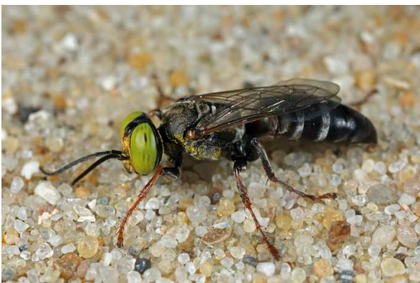
Figuur 2. Man Tachysphex panzeri .

Op 7 juni een man (Fig. 2) en op 11 juli een vrouw in het Weerterbos. Deze soort wordt zelden in het binnenland waargenomen (Ac. 173-366 en 173-367).