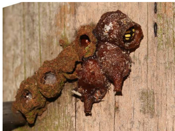
Figuur 4. Weidepaal met oude en nieuwe broedcellen van Anthidiellum strigatum .

Op 29 juni, in de Mortelen, gemeente Oosterwijk (Ac. 151,7-394,2). Aan een weidepaal vier oude broedcellen met daar tegenaan twee nieuwe en een derde waaraan nog gewerkt wordt (Fig. 4). Op 7 juli is ook de derde cel klaar. Er wordt geen nieuwe meer bij gemaakt. Opmerkelijk dat uit de vele weidepaaltjes juist twee keer deze plek is gekozen.