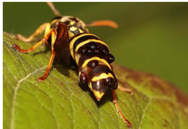
Figuur 1. Vrouw Polistes dominula met 7 Strepsiptera poppen.

Allodynerus delphinalis [SvdE] Twee mannen op 8 juni, Texel, De Muy (Ac. 115,486-570,828), twee vrouwen uit de malaiseval, 20-27 juni, Texel, Bollekamer (Ac. 111,283-561,679). Dolichovespula norvegica [SJ] Op 21 juli een man in Oirsbeek, op de Beukenberg (Ac. 191,5-329,6). Polistes dominula [BvP] Een vrouwtje met 7 poppen van Xenos vesparum in het achterlijf, op 11 juli in de achtertuin in Veghel (Ac. 166,2-404,1) (Fig. 1).