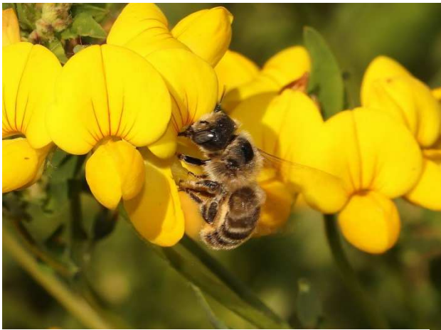
Figuur 5. Hoplitis tridentata , vrouw.

Een vrouwtje op 30 juli op gewone rolklaver ( Lotus corniculatus ) (Fig. 5) nabij rotonde op industrieterrein Poort van Veghel (Ac. 164,0-401,1). Ook op 30 juli een vrouwtje in de Binckhorst in Den Haag (Ac 83-454). Op 15 mei een vrouwtje in Borgharen (Ac. 175-321).