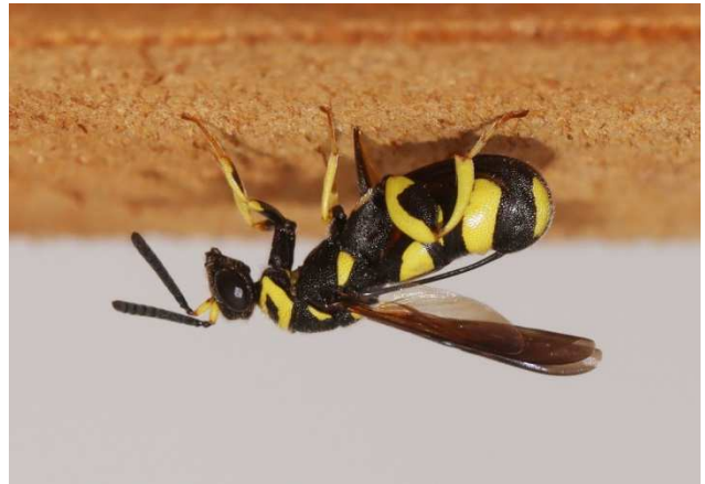
Figuur 4. Op 23 augustus 2021 boort deze Leucospis dorsigera ♀ door meranti naar een gang van de rosse metselbij.

Dat herhaalde zich op een andere plek op 23 augustus. Daarna heb ik haar niet meer gezien. Nu afwachten of er van de inteeltheitjes iets terecht komt.