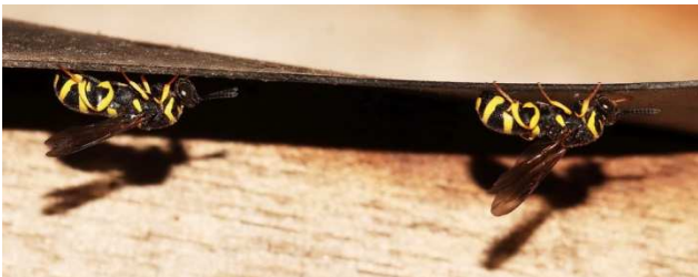
Figuur 2. Twee broers slapend onder een overstekje van vijverfolie.

Toen viel mijn oog op nog zo'n wesp iets verderop onder een overstekje en daarachter zat er nog een. De hele dag ben ik steeds weer even gaan kijken en uiteindelijk waren er 5 exemplaren waarvan er één bijna de helft kleiner was dan de andere 4. Ze hebben enkele dagen wat op die plek rondgehangen en verdwenen een voor een, hoewel ik in de weken daarna nog regelmatig een exemplaar op dezelfde plek terugzag als de eerste keer. Soms sliepen er twee hangend onder een overstaande rand (Fig. 2). Langzaam maar zeker kwam bij mij de twijfel boven dat hun moeder maagdelijk was geweest en dus alleen onbevuchte eieren had kunnen leggen. Echter op 17 juli 2021, bijna vier weken na de eerste waarneming