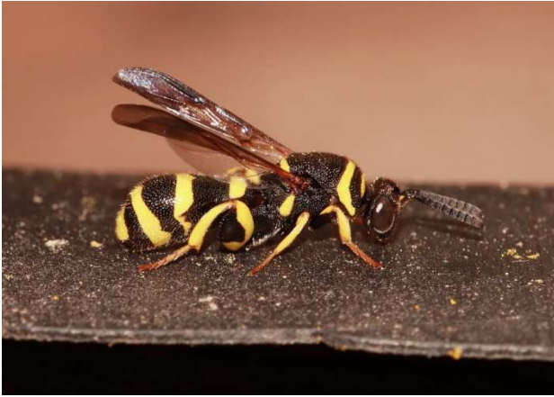
Figuur 1. De eerste mannelijke Leucospis dorsigera die ik ooit zag en nog in mijn eigen tuin ook.

Toen viel mijn oog op nog zo'n wesp iets verderop onder een overstekje en daarachter zat er nog een. De hele dag ben ik steeds weer even gaan kijken en uiteindelijk waren er 5 exemplaren waarvan er één bijna de helft kleiner was dan de andere 4. Ze hebben enkele dagen wat op die plek rondgehangen en verdwenen een voor een, hoewel ik in de weken daarna nog regelmatig een exemplaar op dezelfde plek terugzag als de eerste keer. Soms sliepen er twee hangend onder een overstaande rand (Fig. 2). Langzaam maar zeker kwam bij mij de twijfel boven dat hun moeder maagdelijk was geweest en dus alleen onbevuchte eieren had kunnen leggen. Echter op 17 juli 2021, bijna vier weken na de eerste waarneming