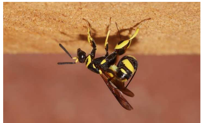
Figuur 5. Na het deponeren van een ei trekt ze haar legboor uit het hout.