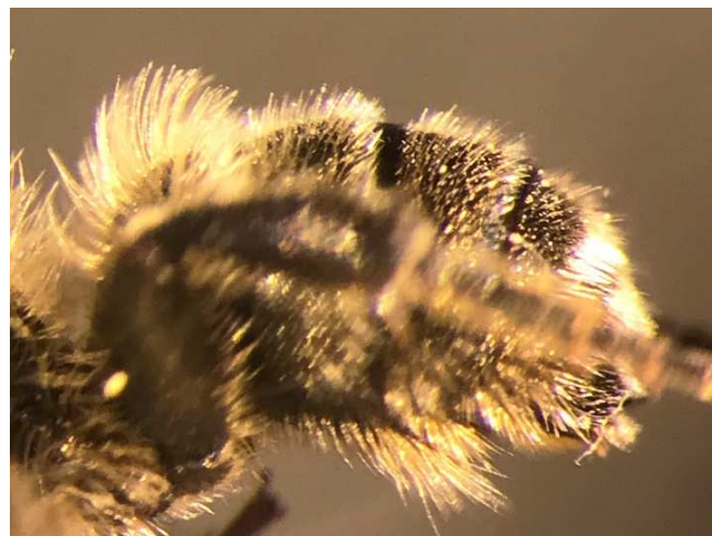
Figuur 1-2. Achterlijf Osmia -mannetjes in zijaanzicht, links O. leaiana , rechts O. niveata .