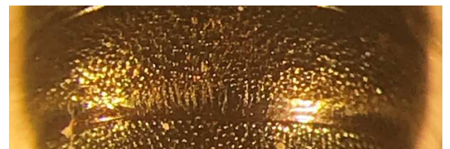
Figuur 3-4. Tergiet III Osmia -mannetjes in bovenaanzicht, links O. leaiana , rechts O. niveata .