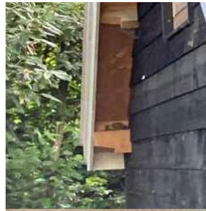
De zelfbouw-vliegenvanger-kast werd niet gewaardeerd. Daarentegen bleek een uitstekende balk onder het dakoverstek de ideale plek om te nestelen.