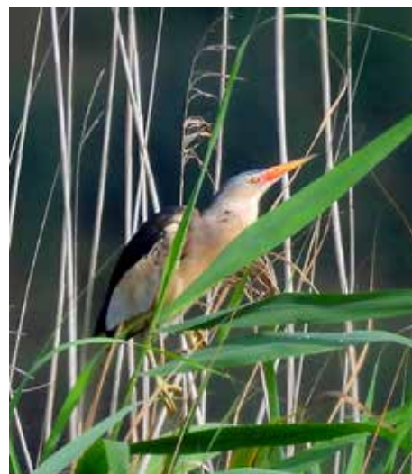
Woudaap, 4 juli Everdingen Uiter- waard.