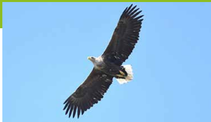
Zeearend, 16 april, Redichemse waard.