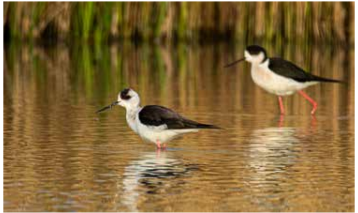
Steltkluut, 9 april Acquoy, Kooise Camping & Kooise Natuur.