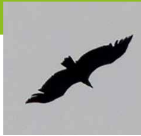
Vale Gier, 18 juni, Parijsch.