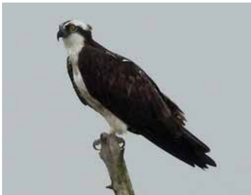
Visarend, 10 september Everdingen Uiterwaard.