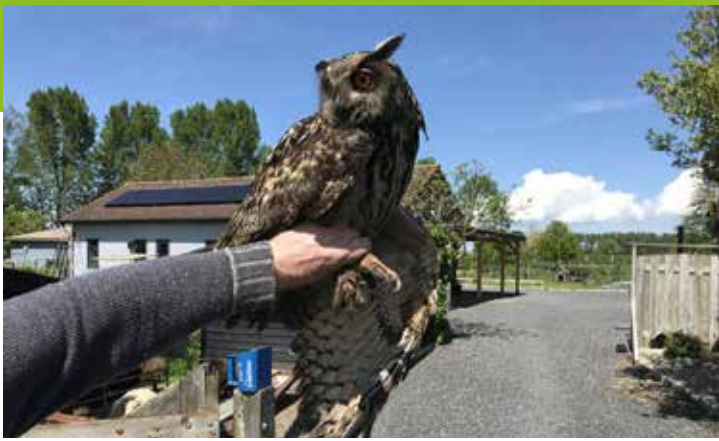
Oehoe, 28 mei Schoonrewoerd, Polder Kortgerecht.