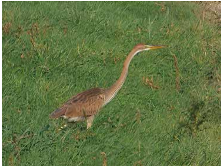
Purperreiger, 10 oktober Culemborg, Ringelpoel e.o.