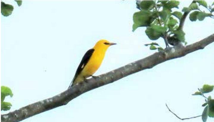
Wielewaal, 30 mei, Zandput Rietveldseweg.