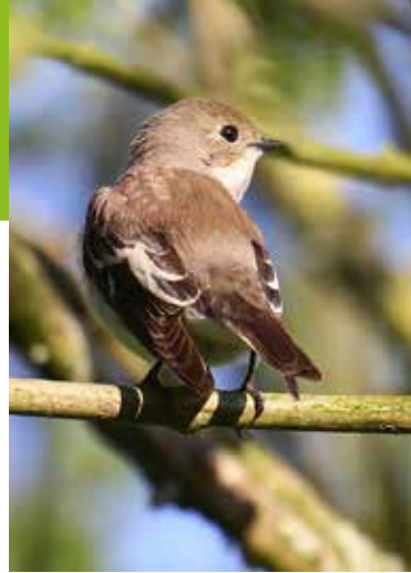
Bonte Vliegenvanger, 26 april Fort Everdingen.