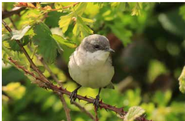
Braamsluiper, 24 april Everdingen Uiterwaard.

vliegen en op 24 april rustte er een in de uiterwaard bij Everdingen.