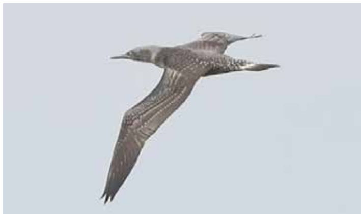
Jan-van-gent, 26 september, Redichemse Waard.