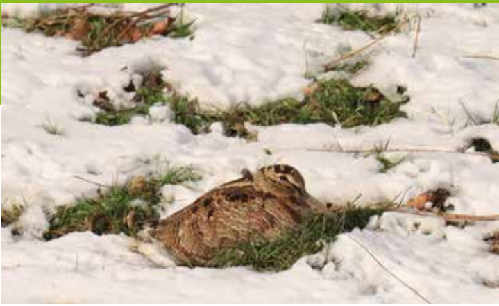
Houtsnip, 14 februari Polder Everdingen.