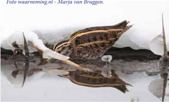
Bokje, 9 februari Industrieterrein Paveien.