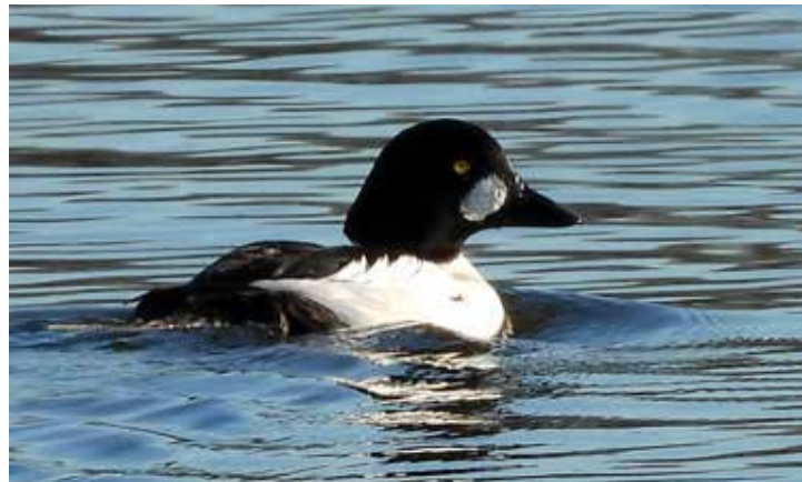
Brilduiker, 22 november, Everdingen Uiterwaard.