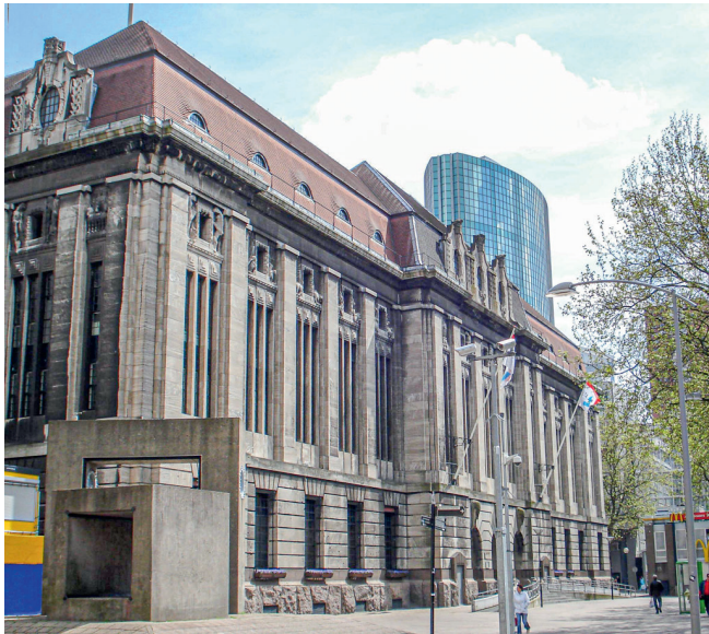
▲ Afb. 1. Rotterdams Postkantoor.

leidt je wel naar onverwachte plekken in Nederland en brengt je tevens in aanraking met geologie. Het kan beschouwd worden als een bijzondere reisgids, waarmee je zelf je route kunt bepalen. Jammer is dat Reumer zijn vraag op pag. 51 van de eerste druk met betrekking tot het leegstaande postkantoor in Rotterdam, dat geheel is opgetrokken uit Kirchheimer Muschelkalksteen, in de tweede uitgave nog niet kan beantwoorden (afb. 1). Het is te hopen dat het Rotterdamse postkantoor openbaar toegankelijk blijft en de vloer met de grote Orthoceras te bewonderen blijft. Met betrekking tot Van Deinze corrigeert Reumer zichzelf dat eigenlijk dr. Willemse de eerste stadspaleontoloog was. Hij publiceerde al in februari 1971 over dit onderwerp in de ANWB Kampioen.