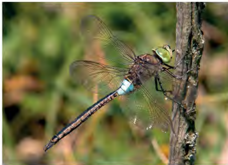
De Zuidelijke Keizerlibel komt steeds noordelijker voor