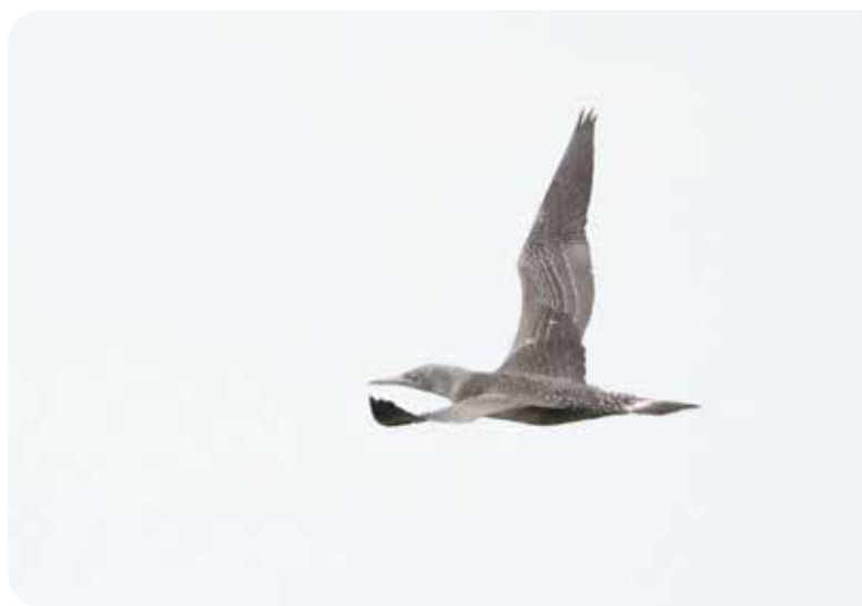
Tabel 1: Overzicht binnenlandwaarnemingen vanaf 1975. Foto's: Juveniele jan-van-gent boven de Redichemse Waard 26-09-2021.