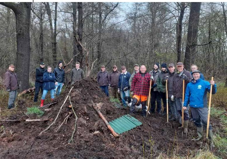
Broeihoophelden van SBB in de Achterhoek.

Veel werkgroepen zijn al bij broeihopen.nl aangesloten en ontvangen een paar keer per jaar de broeihoopnieuwsflits. Deze zijn terug te vinden op www.ravon.nl > Doe mee > Vrijwilligers Informatie Portaal > Aan de slag > RAVON Nieuwsbrieven. Nog niet aangesloten bij broeihopen.nl als werkgroep, of heb je interesse in het maken van broeihopen? Contacteer dan de landelijk coördinator Tariq Stark ( t.stark@ravon.nl ).