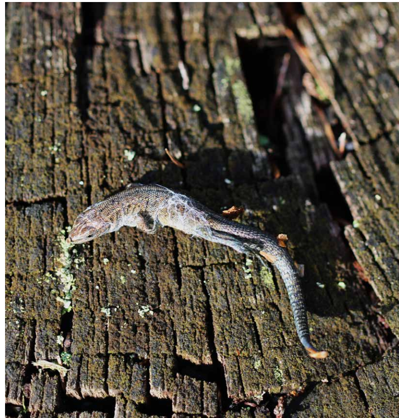
De nog deels ingesponnen juveniele levendbarende hagedis.

In Schubben en Slijm 52 (pagina 16) deed Gert Verrijdt melding van een levendbarende hagedis gevangen in web van viervlekwiwebspin.