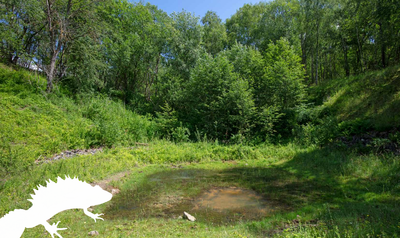
In groeve 't Rooth is in 2015 voor het laatst een kamsalamander waargenomen.