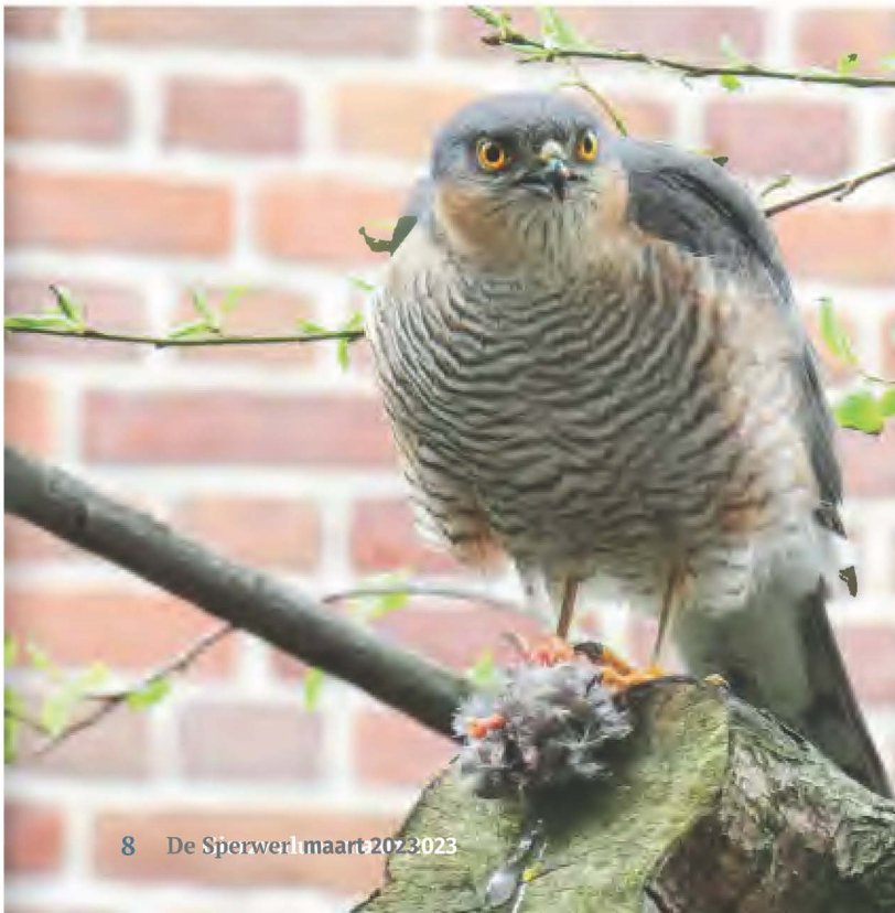
8 De Sperwer | maart 2023

“Ik kwam net terug van een wandeling, een beetje teleurgesteld omdat ik niet heel veel vogels had gezien en nauwelijks een foto had kunnen maken. Ik had mijn jas nog aan, mijn fototoestel nog om en keek gewoontegetrouw uit het raam. Ik wist niet wat ik zag! Nooit eerder had ik een Sperwer in mijn tuin gezien, terwijl ik er bijna twintig jaar gewoond heb. Hij zat op een tak van mijn boom, op zo'n twee meter bij mij vandaan. Kennelijk schrok hij totaal niet van mij of van mijn fototoestel, want hij bleef rustig zitten eten, trok zijn prooi helemaal aan flarden en zat daar zeker nog een minuut of tien.”