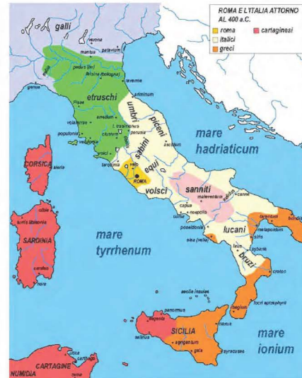
De volkeren in Italië rond 400 v. Chr

De bange vermoedens van de Romeinen kwamen uit: nadat de Galliërs Rome hadden bereikt, brandschatten ze de stad en begonnen ze de gebarricadeerde burcht van het Capitool te belegeren. Maar de muren waren steil en het was de Romeinen telkens nog gelukt om de aanvallen af te slaan. Daarom besloten de Galliërs om over te gaan tot een nachtelijke expeditie om de nog aanwezige Romeinen te overvallen met een verrassingsaanval. In opperste stilte beklommen de Gallische soldaten de burcht, waarbij, zo vermeldt Livius, zelfs de waakhonden en Romeinse wachters hen niet opmerkten. Maar waar de Galliërs niet op hadden gerekend, waren de ganzen van Juno! Zodra die waakzame dieren het onraad bespeurden, begonnen ze luid te gakken en te klapperen met hun vleugels,