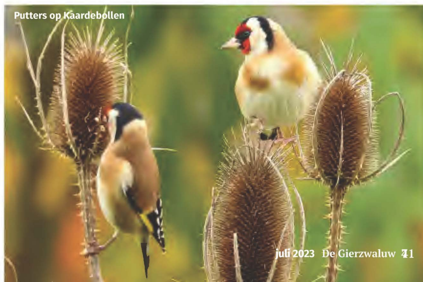
Putters op Kaardebollen

En dan is het óók heerlijk ontspannend: die focus op een duidelijke welomschreven taak, tijdens het – voor mij – mooiste moment van de dag, rond zonsopgang, want dan zingen de (meeste) vogels. Behalve door het mooie licht en de dito luchten is het dan ook nog heerlijk stil; met uitzondering van de vogels. We zien in alle vroegte ook bijna niemand op straat, op een doodenkele vroege atleet in training na, of een zwalkende 'nutteloze van de nacht'. Later in het voorjaar zijn er ook nog twee avondrondes voor soorten die zich dan juist goed laten horen. Wel lastig in het Diemerpark zijn de luidruchtige binnenvaartschepen op het Amsterdam-Rijnkanaal. Die verstoren de idylle nogal eens.