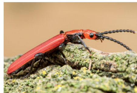
1. Imago van de vermiljoenkever Cucujus cinnaberinus . 1. Adult of Cucujus cinnaberinus .

erschließt sich Lebensräume in Norddeutschland (Coleoptera: Cucujidae). Entomologische Zeitschrift · Schwanfeld 126: 208-210.