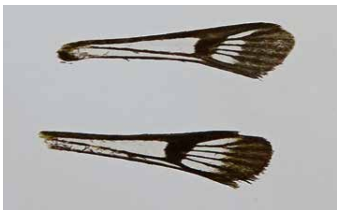
3. Voorvleugels van Synanthedon flaviventris met gemiddeld en ver-groot buitenste glasveld.