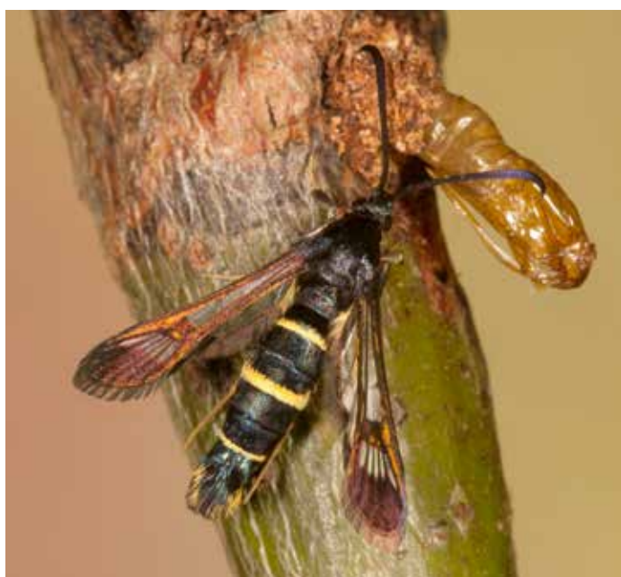
4. Vrouwetje van Synanthedon flaviventris . Ethe (Luxemburg, België), ex larva 21.iv.2013, imago uitgekomen op 13.vi.2013.