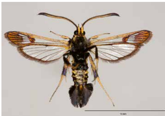
2. Mannetje (onderszijde) van Synanthedon flaviventris . Dinant (Namen, België), ex larva 21.iv.2013, imago uitgekomen op 10.vi.2013.