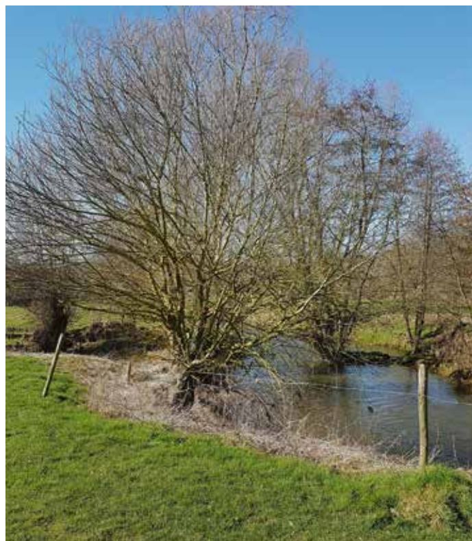
5. Habitat van Synanthedon flaviventris met oude gallen op boswilg. Geuldal (Limburg), 3.iii.2022.

In het Geuldal is op alle aangetroffen wilgensoorten naar S. flaviventris -gallen gezocht maar ze zijn alleen gevonden op boswilg. In het eerste levensjaar leeft de rups onder de schors zonder dat de schade aan de twijg uiterlijk zichtbaar is. De rupsen worden pas in het tweede levensjaar gevonden wanneer zich een gal heeft gevormd. De gal bevindt zich ongeveer 50 cm onder het uiteinde van de twijg (Rämisch & Gelbrecht 2008) en soms bijna aan de top (Rudi Goossens persoonlijke mededeling). Aan de basis van de gal heeft de rups onder de schors een gang geknaagd die rondom de twijg loopt. Boven de gal bevindt zich in het mergkanaal een uitkomstgang. Bij vijf oude gallen uit het Geuldal was de gang tussen 2,9 en 3,7 cm lang (eenmaal 6,5 cm) en ongeveer 2 mm breed. Aan de zijkant van de gal zitten een of twee gaatjes met een diameter van twee tot drie millimeter, waarlangs de rups frass naar buiten duwt. In de winter wordt deze opening gesloten met donkerbruine frass (Bartsch et al. 1997). De rups construeert geen cocon en verpopt in juni. Een hoog percentage van de rupsen wordt geparasiteerd door schildwespen Braconidae en sluipwespen Ichneumonidae (Bartsch et al. 1997, Vuola & Korpela 1980). Predatie door mezen wordt regelmatig waargenomen (Bartsch et al. 1997).