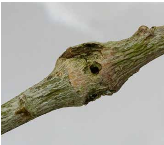
1. Oude gal van Synanthedon flaviventris op boswilg. Geuldal (Limburg), 15.iii.2022.

Sobczyk (1997) kon aantonen dat de variabiliteit vooral bij dit glasveld aanzienlijk is en dat het bij sommige imago's breder is (n=72). De geelbuikwespvlinder lijkt het meest op de nauwverwante sneeuwbalwespvlinder S. andrenaeformis (Laspeyres), die vergelijkbare witte en citroengele vlekken aan de onderkant van het abdomen heeft. In tegenstelling tot S. andrenaeformis is het achterlijfspuimpje bij S. flaviventris niet oranjegeel maar zwart en bij de vrouwtjes zijn de zijkantoren oranje gekleurd (figuur 4). Imago's die op nectarplanten foerageren kunnen in Nederland worden verward met de vrij gelijkende bessenglasvlinder S. tipuliformis (Clerck) en spulers wespvlinder S. spuleri (Fuchs).