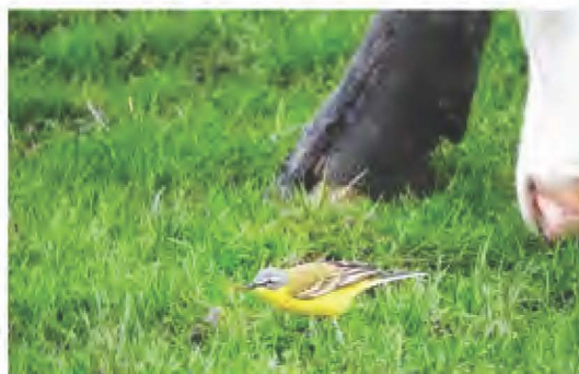
Gele Kwikstaart op het landje van Geijssel

Hoewel het landje slechts 9 hectare omvat, is het aantal vogelsoorten dat hier op jaarbasis wordt gesignaleerd indrukwekkend. Als we af mogen gaan op waarneming.nl zijn er in de loop der jaren maar liefst 195 verschillende