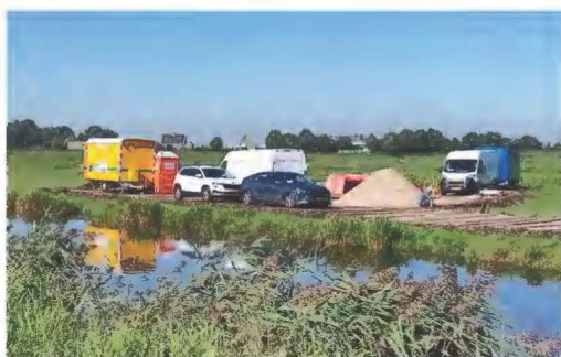
De reparatie van het kabellek

Daarbovenop is ongelukkigerwijze dit voorjaar aan de zuidzijde een olielekage ontstaan in een elektriciteitskabel die door het landje loopt. Die plek is eerst afgebakend en deze zone is later wèl drooggelegd om eventuele verspreiding van de vervuiling te voorkomen. De pleister- en slaapplaatsen liggen vooral aan de noordkant van het