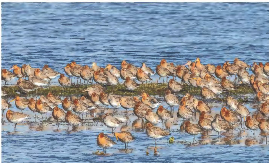
De IJslandse Grutto is een ondersoort en roder van kleur dan onze Grutto

opzoeken. Dit blijkt uit slaapplaatstellingen die ondergetekende sinds 2011 voor Sovon Vogelonderzoek verricht.