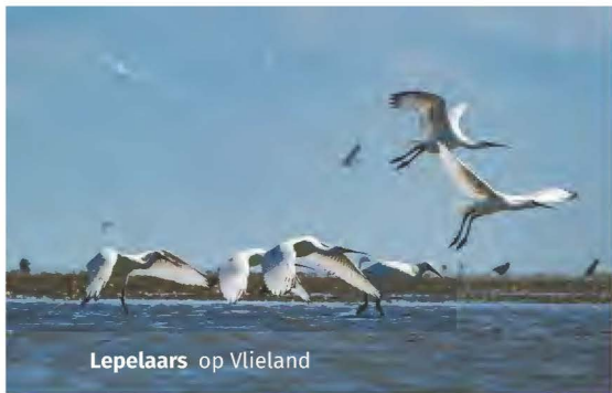
Lepelaars op Vlieland

soms wat streng wordt toegesproken: “Wadvogels en het waddenleven in het algemeen zijn gebaat bij rust. Net als de Waddenzee-bezoekers overigens”. Fratsen zoals “sporten op het wad, vrijgezellenfeestjes in de speedboot en zand-plaat yoga” trekken volgens de auteur Dirk Hilbers “een onnodig zware wissel op Nederlands’ belangrijkste natuurgebied” (p. 352).