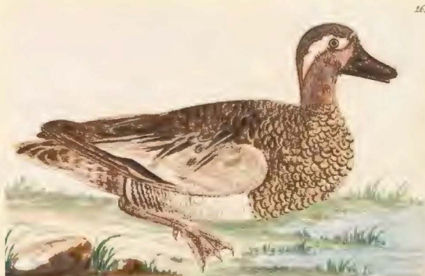
TEKENING: ANSELMUS BOËTIUS DE BOODT, 1596 - 1610

Eén taling maakt geen zomer, maar toen ik niet zo lang geleden die ene Zomertaling zag in Waverhoek, brak toch de zon een beetje bij me door. Want het zijn fraaie eenden, vooral het mannetje met zijn eenvoudige maar uitgebalanceerde kleurencombinatie, prachtig afgewerkt met een forse witte penseelstreek van oog tot nek. Persoonlijk vind ik zijn kop veel mooier dan die van neef Wintertaling, bij wie ik altijd het gevoel heb dat de tekening van het groen op die bruine kop niet klopt, alsof ze een kledingstuk over hun hoofd hebben getrokken dat heel ergens