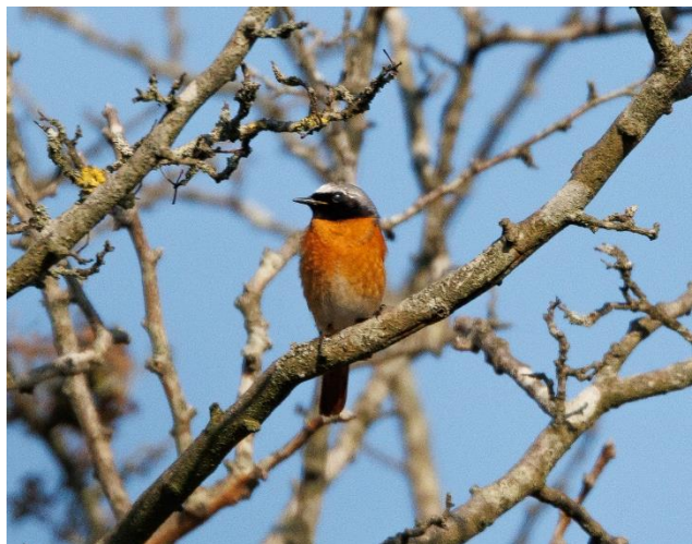
Gekraagde Roodstaart

De Havik, die vorig jaar door Nijlganzen van het nest werd gepest, probeerde het opnieuw met een ander nest, maar