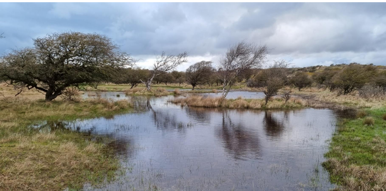
In de beginperiode ook veel plassen in het Wolfsveld met 1x een Meerkoet