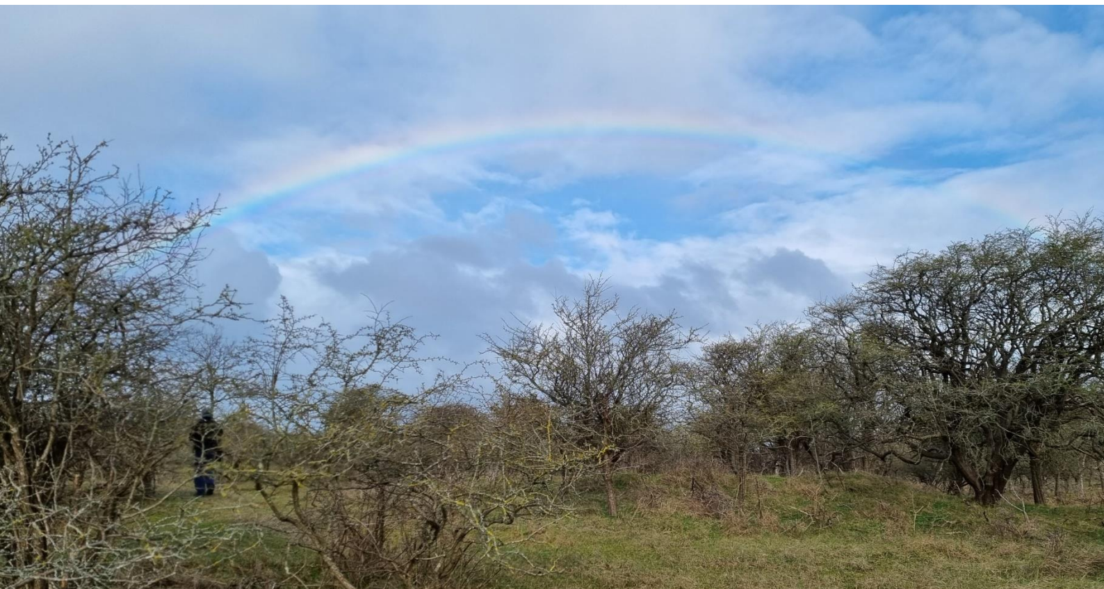
Eind maart/begin april was door kou en wind niet de makkelijkste periode voor de waarnemers