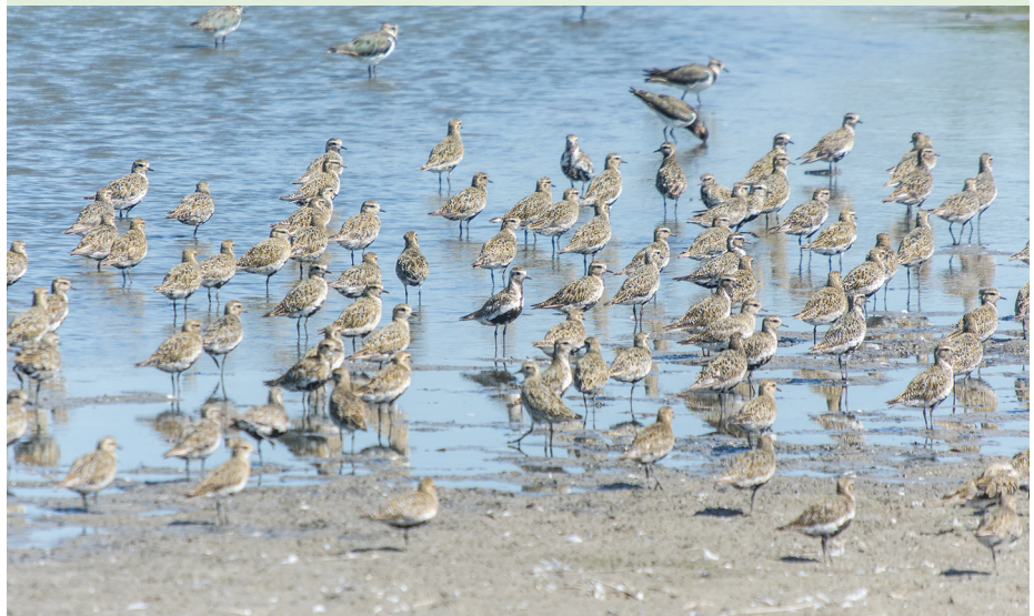
goudplevieren op de slikken in augustus.

Zelf zien hoe dit werkt, kom dan mee met de excursie naar de Slikken van de Heen op 28 mei om 9:00 uur. De excursie duurt ongeveer 2 uur. Op de Slikken van de Heen gaat de natuur al zo'n 30 jaar haar gang. Er lopen runderen, paarden en sinds kort ook wisenten in natuurlijke sociale groepen en in evenwicht met het landschap. Bloemrijke graslanden, open bos en struvelen wisselen elkaar af in een open boslandschap waar opbouw en afbraak elkaar afwisselen. Verzamelen op de kleine parkeerplaats op de kruising Campweg met de parallelweg van de N257 op Sint Philipsland. Laarzen zijn aan te raden. Het kan er plaatselijk erg modderig zijn. Aanmelden voor deze excursie is verplicht via het e-mailadres: tomvanwanum@xs4all.nl