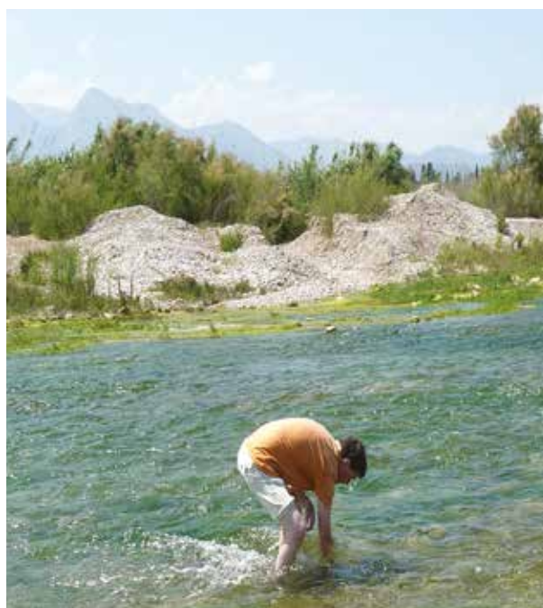
Fig. 2. Zoetwatermollusken verzamelen in de Karpuzcay rivier, Antalya, Turkije.