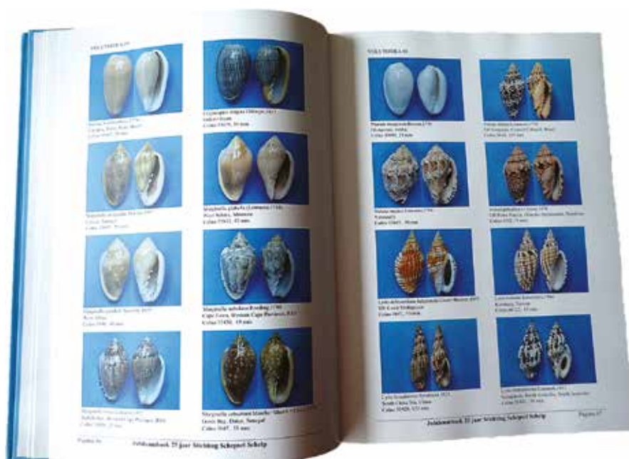
Fig. 3. Inblikje in het jubileumboek.

nog in Utrecht te zien. Een kleiner deel van de (vooral fossiele) schelpen is geschonken aan het Natuurhistorisch Museum Rotterdam (NHMR). Het betreft 1000 monsters fossiele schelpen uit Florida (NHMR, 2011) en 600 monsters recente schelpen (NHMR, 2013).