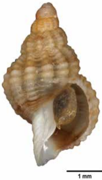
Fig. 3. Verdikte fuikhoorn Nassarius incrassatus (juveniel) van het wrak van de SS Tubantia; maatstreefje: 1 mm.