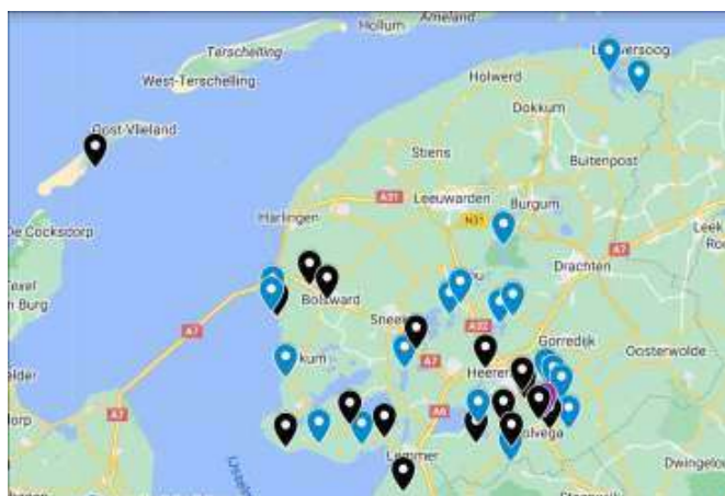
Figuur 3. Wasbeerhond in Fryslân in 2023 tot 10 nov. Zwart: dood dier (17x), paars: idem, met zender (1x), blauw: zichtwaarneming (19x).

Wasbeerhond. https://www.zoogdiervereniging.nl/zoogdiersoorten/wasbeerhond