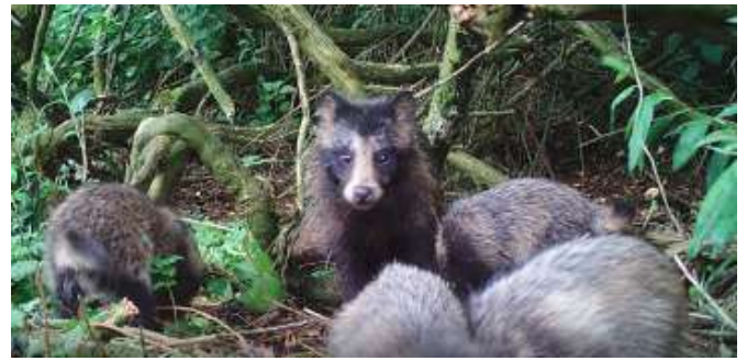
Figuur 6. Van de fotocamera IJsselmeer, ouder met vier jongen. Warns 2022 (H. Bosma).