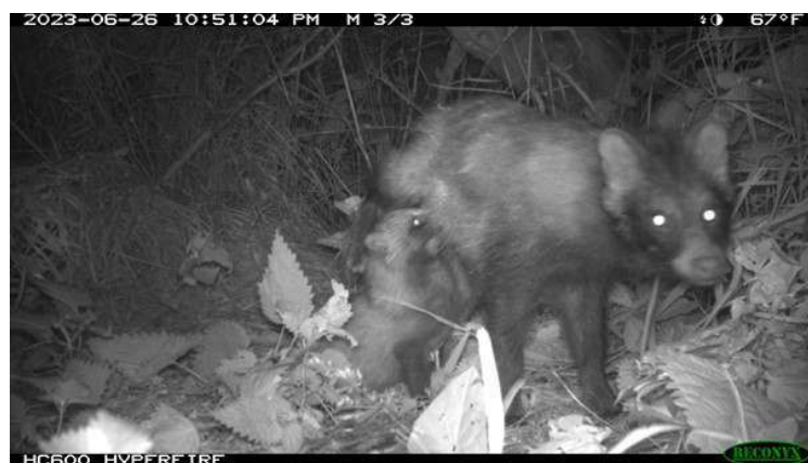
Figuur 9. Moeder laat jongen drinken, IJsselmeerkust bij Warns 2023.