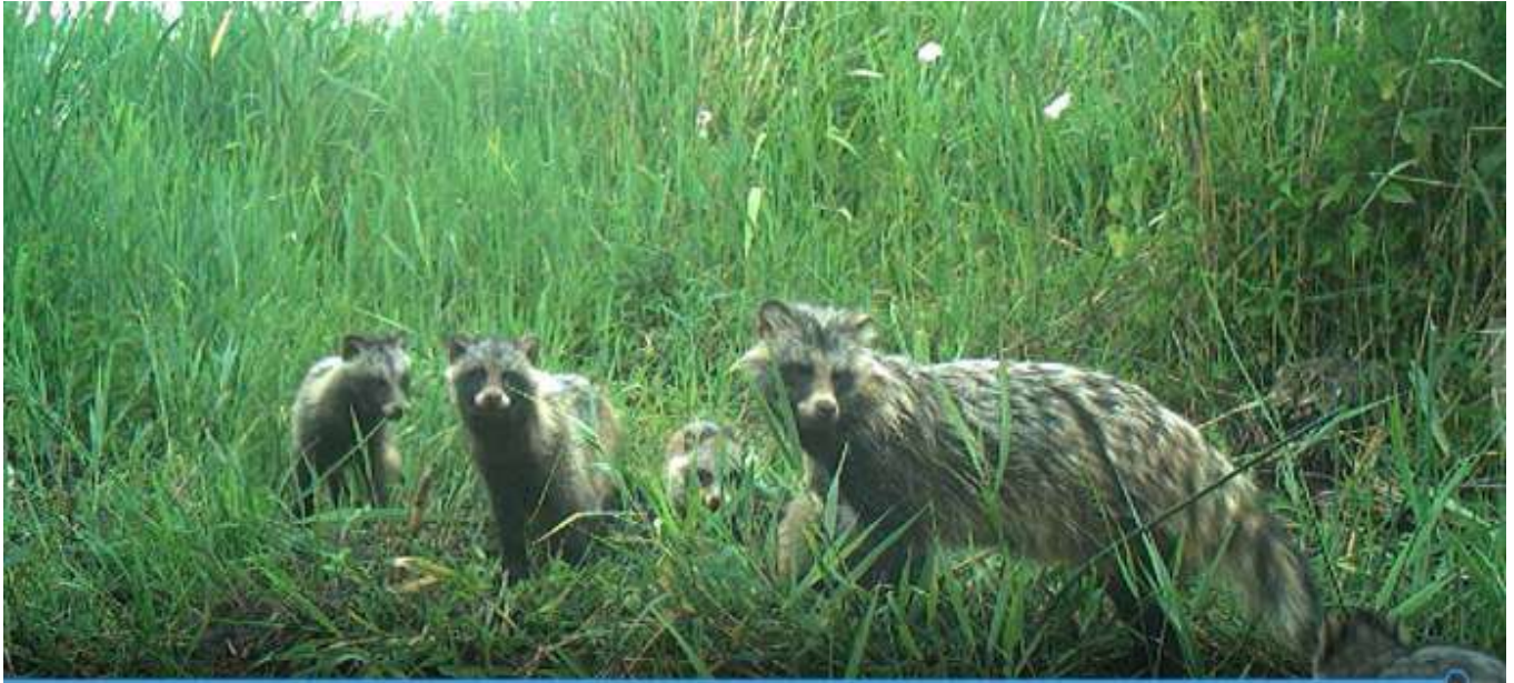
Figuur 1. Wasbeerhond, ouder met 6 jongen. IJsselmeerkust, Workum 2022

De redactie heeft zijn verhaal voorzien van informatie over de motieven voor plaatsing van de soort op de Unielijst – zie het kader.