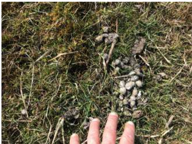
Figuur 5. Keutels van Wasbeerhond, IJsselmeer kust bij Workum.