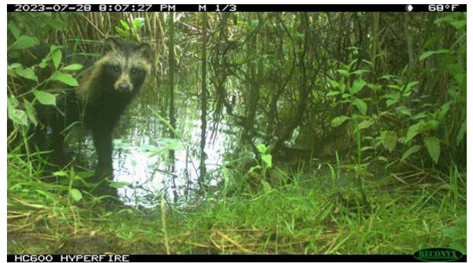
Figuur 7. Van de fotocamera IJsselmeer kust: jong dier, Warns 2023 (H. Bosma).