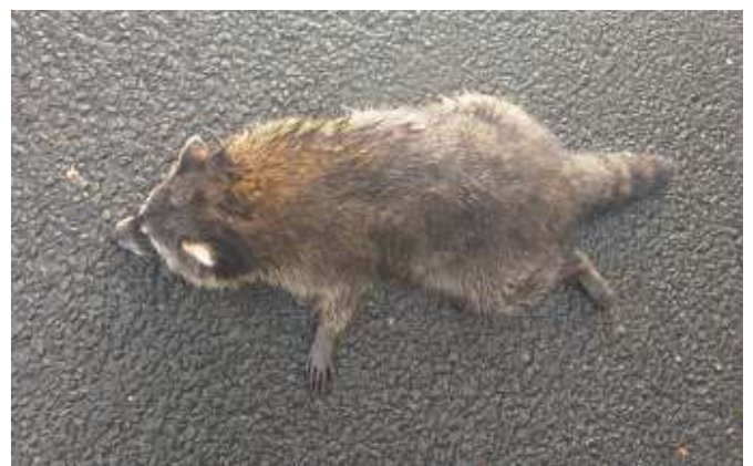
Figuur 2. Wasbeer (zie de geringde staart !), verkeersslachtoffer tussen Oudeschoot en Wolvega 15 oktober 2023.

De Wasbeerhond (figuur 1) is een heel ander dier dan de Wasbeer (figuur 2). Qua uiterlijk, maar ook is zijn gedrag totaal anders. De Wasbeerhond klimt en graaft niet, de dieren hebben een gezamenlijke latrine. De Wasbeer kan goed klimmen en heeft een geringde staart. Zo zijn er nog