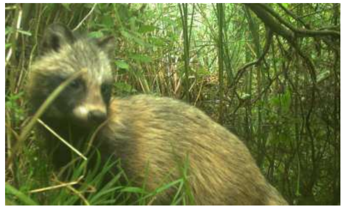
Figuur 8. Wasbeerhond aan IJsselmeerkust, 2021.