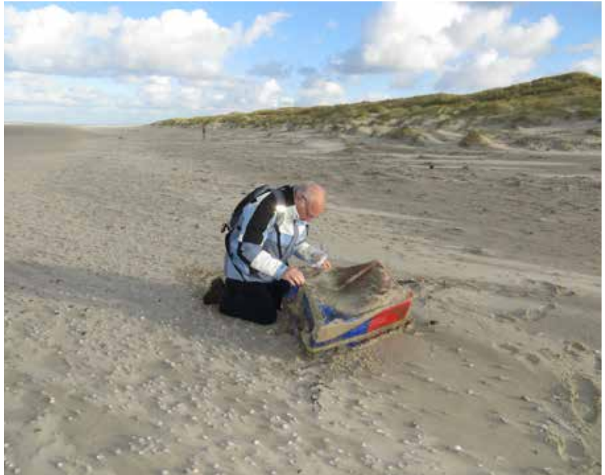
Fig. 2. Ter hoogte van paal 26 lag een grote, plastic viskral op het strand. Deels rood met blauw geveerd, die gelet op de tekst van Franse origine moest zijn.

leveren. Een klein wit schelpje, waarvan ik aanvankelijk dacht dat het een Heteranomia zou zijn. Toch maar veilig gesteld. Het bleek later een vondst van heb ik jou daar te zijn, namelijk een gaaf doubletje van een Kleine glasmantel.