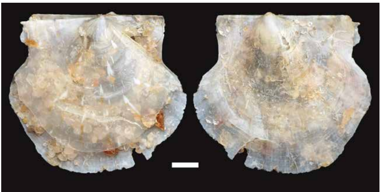
Fig. 3. Kleine glasmantel Similipecten similis van het strand van Texel. Maatstreep is 1 mm.

De volgende vondst is van een heel andere aard en luistert naar de bekende Nederlandse naam "Ovale poelslak". Op zich een