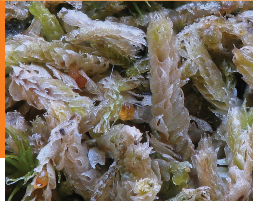
Gebogen kantmos.