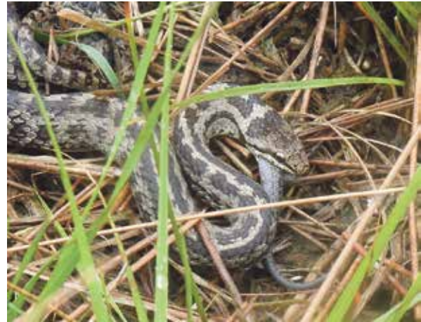
Gladde slang eet andere slang (adder?), 12 augustus 2023 Dwingelderveld.

Op 12 augustus 2023 besloten mijn broer en ik naar het Dwingelderveld te gaan. Ik had al heel lang de grote wens om een slang in het wild tegen te komen. De weersomstandigheden waren ideaal: het regende tot een uur of 11. Het was nog maar net droog toen mijn broer op een afstand van twee meter van het pad een gladde slang ontdekte. Ik was zo enthousiast dat ik eerst niet in de gaten had dat hij iets in z'n bek had. Ik kon de gladde slang tot op een meter benaderen en de slang rustig fotograferen. Toen drong het tot me door dat er een staart van een dier of een slang uit zijn bek stak. Een soortgenoot? Of toch een adder? Geen idee. Ik schopte per ongeluk tegen een struikje waardoor de slang schrok en snel tussen de struiken verdween.