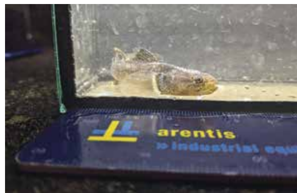
De gevangen shimofurigrondel.

Inmiddels heeft de shimofurigrondel al 12 bevestigde waarnemingen op Waarneming.nl, waarvan het merendeel zich in Biervliet bevindt.