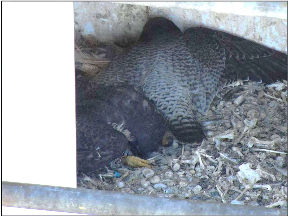
Een drone-inspectie toont 2 dode valken, Geertruidenberg, 3 maart 2023

In Alphen NB , succesvol met 4 jongen, werden plukresten van Wielewaal gevonden, voor ons de eerste keer dat we deze prooi soort tegenkwamen.