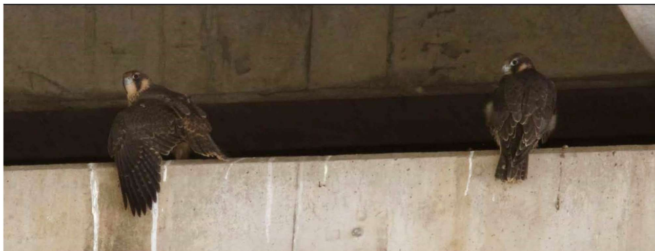
2 van de 3 waargenomen jongen van de Brienoordbrug, 18 juni 2023

De Brienoordbrug , Rotterdam, is niet echt een nieuwe locatie want de laatste 2 jaar belandde er elke keer een pas-uitgevlogen jong in de problemen. Ze werden (nauwelijks vliegvlug) gevonden op de grond of het fietspad en waren een overduidelijk bewijs, dat er een geslaagde broedpoging was geweest. Dit jaar is de locatie van het nest “ongeveer” gevonden en zijn er minimaal 3 jongen gezien.