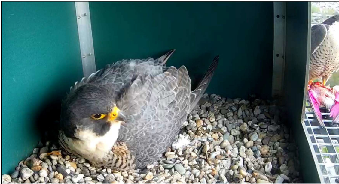
Duivenhouders verven hun duiven om roofvogels af te schrikken. Alphen aan de Rijn, 26 april 2023.