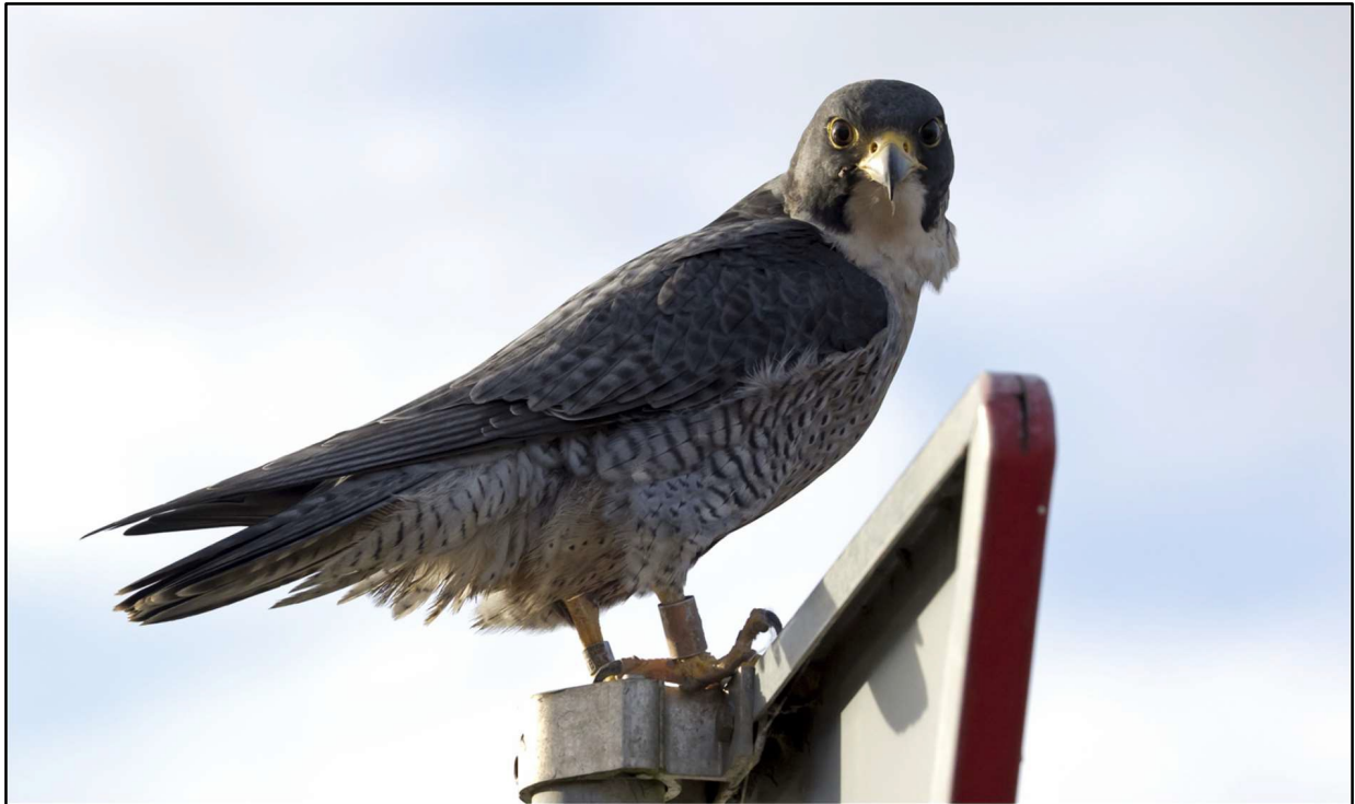
Rotterdammer XF in Serooskerke, Zeeland. 14 januari 2024.

XF is van een broedgeval op de HEF in Rotterdam in 2011. Het jong kwam via het parkje bij de HEF terecht in de Vogelklas en werd op 8-7-2011 weer losgelaten op het dak van het Unilever gebouw. Serooskerke, dus! 12 jaar en 6 maanden na het loslaten, en 52Km verderop.