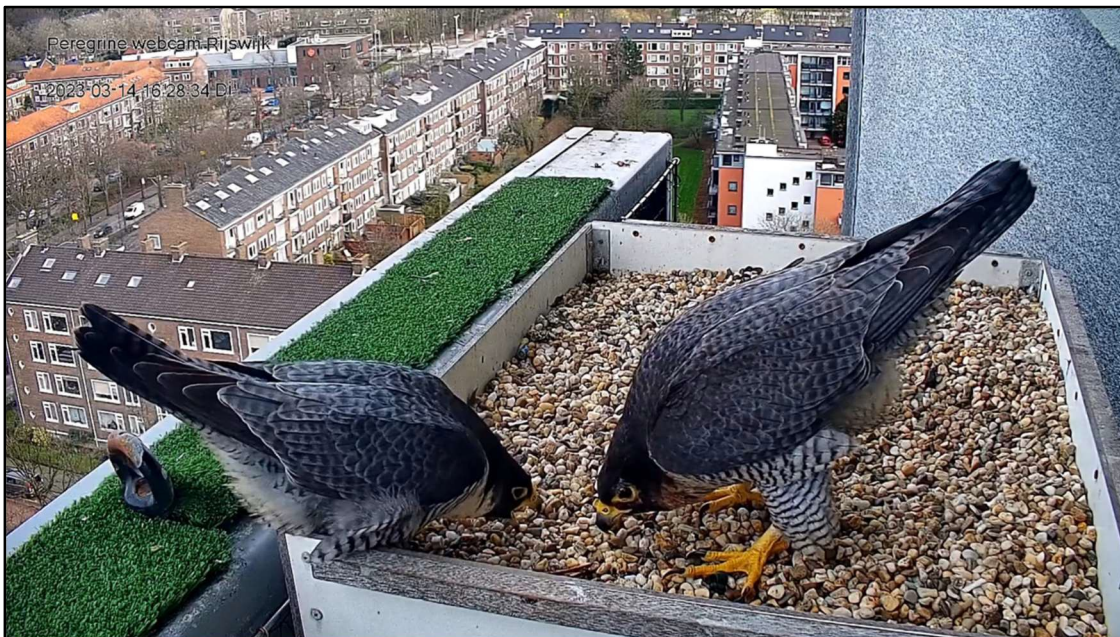
Het koppel in Rijswijk datete wel, maar deed nog niet aan gezinsuitbreiding Rijswijk, 14 maart 2023.