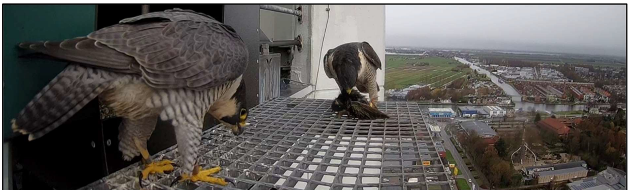
Mannetje bied vrouw een Spreeuw aan, Alphen a/d Rijn.