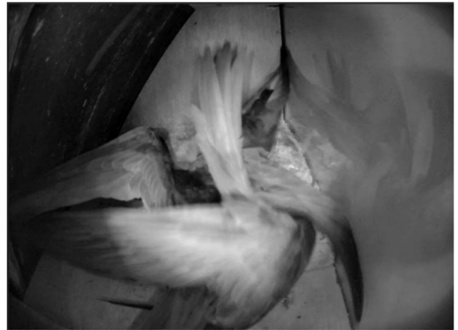
Fig. 2. Gevecht tussen twee Gierzwaluwen in kast G. Een derde vogels zit op het nest - 16 mei 2023

Op 4 mei worden meer dan 4500 trekkende Gierzwaluwen waargenomen op telpost Breskens, de rest komt er nu vast aan. Op 6 mei, een week na de eerste vogel, arriveert een van de vogels in A, en een dag later een in C en een tweede vogel in G. De helft van het aantal broedvogels in 2022 is nu terug. Pas op 11 mei is het stel in A compleet en de volgende dag eindelijk de eerste in E. Langdurige regen heeft de aankomst wellicht vertraagd. Zes van de acht vogels zijn nu terug en het eerste ei kan binnenkort in G worden verwacht. Maar voor het zover is, gooit een indringer roet in het eten. Rond zonsondergang vliegt er