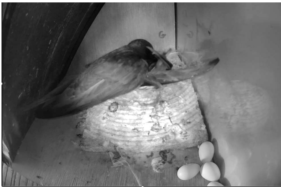
Fig. 3: Broedende vogels in kast G met vier eitjes los in de nestkast.

bek, zwiept hem in de kast, en gaat daarna weer op het lege nest zitten. Wanneer de kast enkele dagen later wordt gecontroleerd blijken er drie eitjes los in de kast te liggen en twee vogels op een leeg nest.....dat schiet niet op.