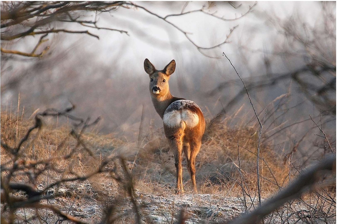
Ree in de winter in de Amsterdamse Waterleidingduinen.