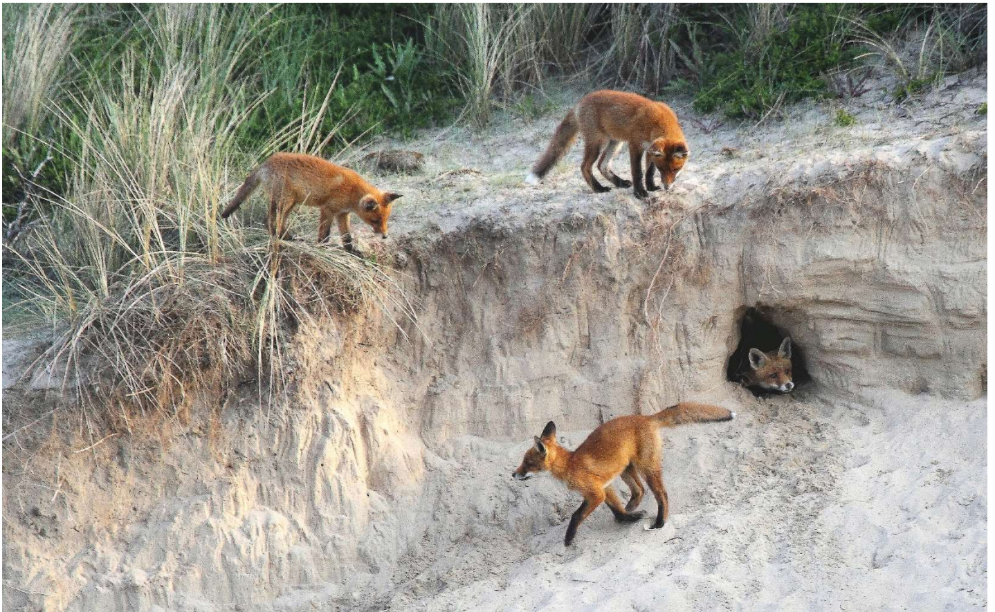
Vossenwelpen in de Noordduinen van Noordwijk