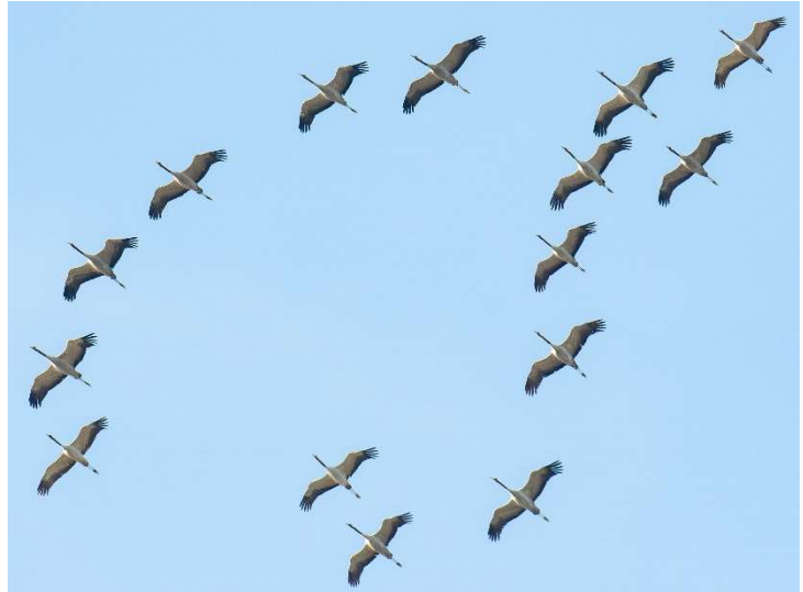
Kraanvogels 2 maart 2024 Oegstgeest – Haaswijk