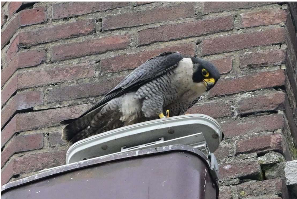
Slechtvalk – 2024-03-17 Noordwijkerhout - Leeuwenhorst

De maand februari was de zachtste sinds het begin van de temperatuurmetingen. De temperatuur was zoals je die normaal in maart kunt verwachten, meest rond de 10°C. Het natte weer van de eerdere maanden zette door. De wind kwam vooral uit het westen en zuidwesten en er was weinig zon te zien.