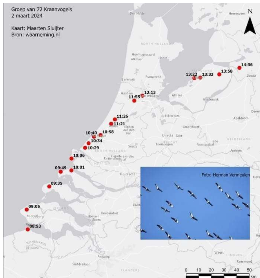
Figuur 1 Trekroute Kraanvogels op 2 maart 2024 (Maarten Sluijter)