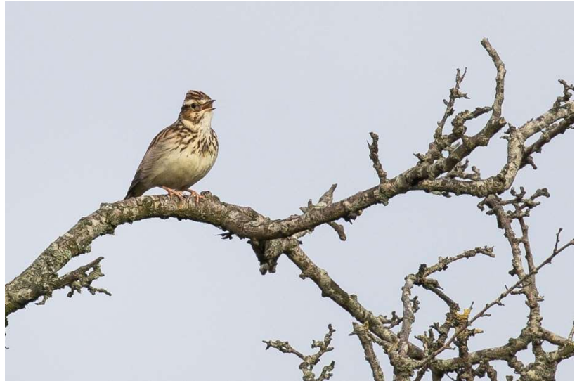
Boomleeuwerik - 2024-02-25 Amsterdamse Waterleidingduinen - Vinkebaandriften / Franse Vlak