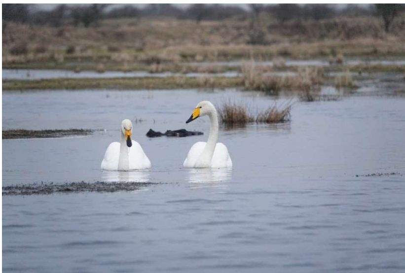
Wilde Zwaan - 2024-01-25 AWD - Haasveld