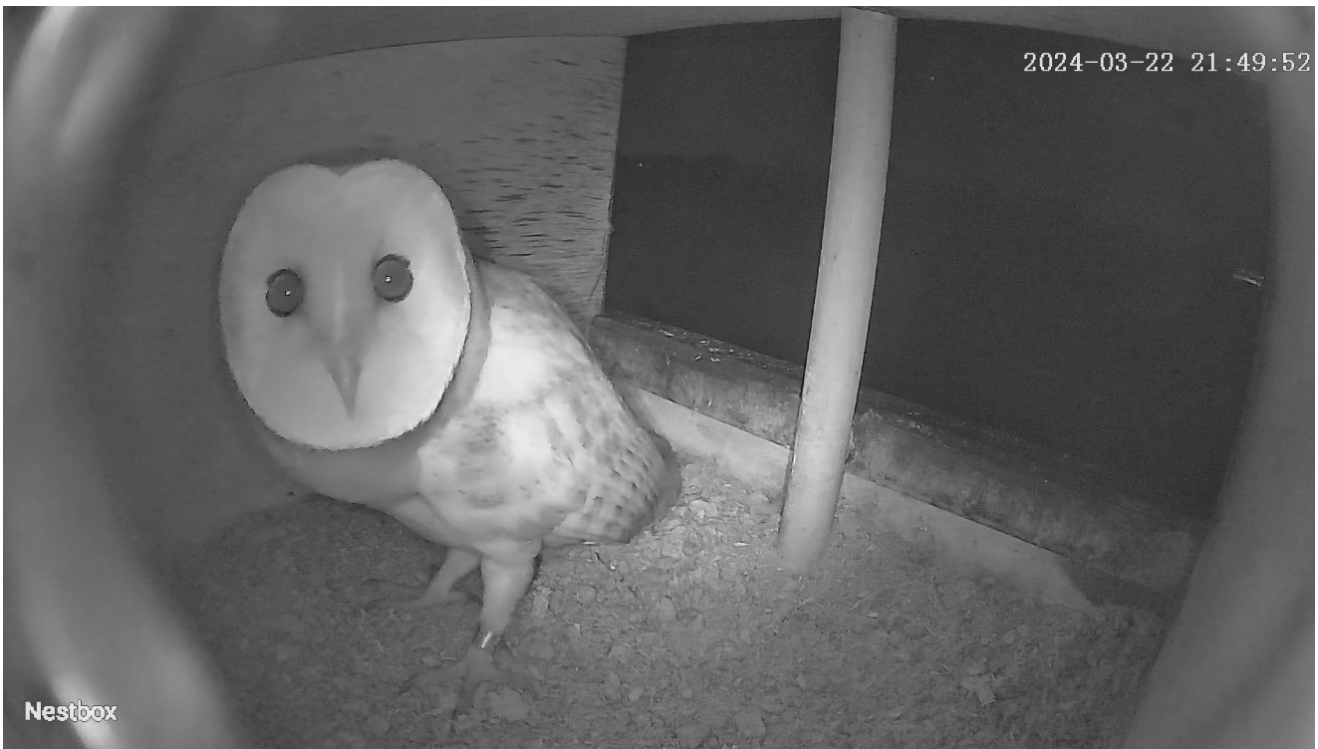
Webcamfoto van Kerkuil in torenvalk kast Noordwijkerhout - 2024-03-22

Ook passeerden er een flink aantal Jan Van Genten , in totaal 47, langs de zeetrekhut (JD BS) en 100 langs de Noordduinen (EM). Op 23 maart vloog een groepje van 15 Grutto's langs de zeetrekhut (JD HO). De volgende dag trokken er bij WNW6 grote groepen Rotganzen langs, met een totaal van bijna 2600 (JD HO PS), de tweede beste dag ooit. Ook vloog er een Parelduiker langs (JD HO PS). Een onvolwassen Grote Jager verbleef langere tijd voor de Noordwijkse kust. Op 24 maart vloog deze over het strand van de Coepelduynen (KK) en op 30 en 31 maart langs de zeetrekhut (JD NM HL ea).