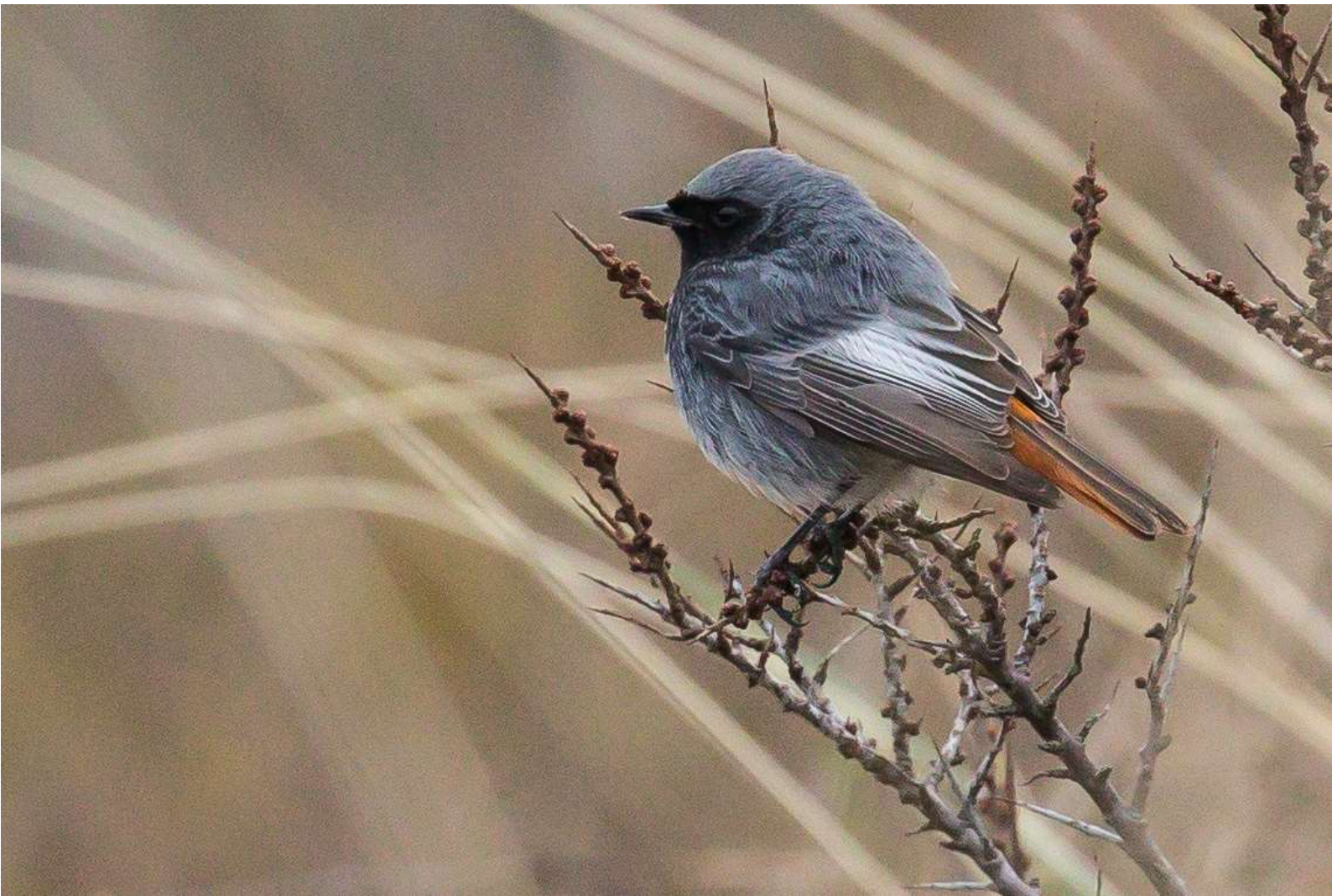
Zwarte Roodstaart - 2024-03-09 Coepelduynen C1