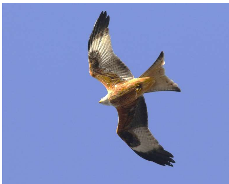
Rode Wouw -2024-01-26 Noordwijk-Binnen

In januari vloog er een aantal keer een Rode Wouw over ons waarnemingsgebied. Op 21 januari hing er één rond in het Hoegatterduin in de AWD (JE). Op 23 januari volgde er een waarneming van een overvliegende vogel over het Langeveld (JHa) en op 26 januari vloog er één over Noordwijk-Binnen en de Bronsgeest (WBo ea), goed herkenbaar als adult. Dit is opmerkelijk want er zijn pas drie eerdere januariwaarnemingen in ons waarnemingsgebied (1995, 2010, 2015). Mogelijk ging het om een vogel die hier een poosje rondzwierf. In de volgende maand volgden tussen 10 en 24 februari opnieuw meerdere waarnemingen in de AWD, de Noordduinen en Willem van den Bergh van (in verschillende richtingen) overvliegende en cirkelende vogels. Op 10 februari ging het om zeker twee vogels. Over de Noordduinen vloog er eerst één naar zuid. Later volgde er één naar noord die vanaf Den Haag was gevolgd en die qua tijd overlapte met de eerste (BS PK EM). Op 14 februari zat er ook één even aan de grond in de Noordwijkerhoutsche Geest (JSp). Op 15 februari cirkelden er twee tegelijkertijd laag over de AWD (VS).