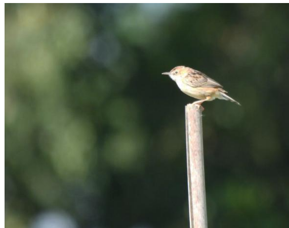
Graszanger bij Dommelen, 7 augustus 2023

In exact hetzelfde gebied blijkt ook vorig jaar al een Graszanger te hebben gezeten. De vogel werd in augustus 2023 door Wilma Verouden gedurende minstens twee weken gezien en op 7 augustus, zittend en zingend, door haar gefotografeerd. Ook nu werd voldaan aan de criteria voor een territorium.