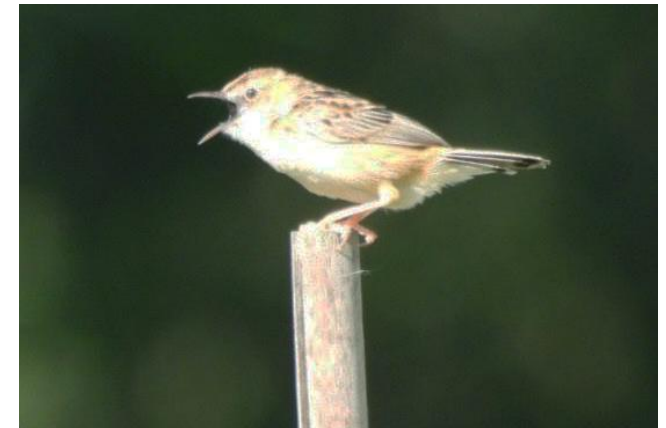
Graszanger bij Dommelen, 7 augustus 2023

Zou het om dezelfde vogel kunnen gaan? En heeft die in het gebied overwinterd? We weten het uiteraard niet, maar het zijn wel intrigerende vragen die opborrelen.