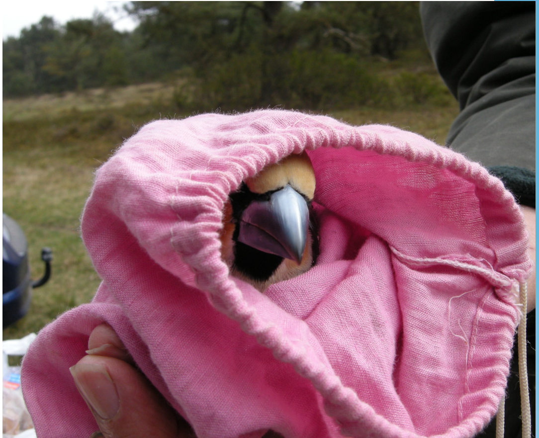
Kiekeboe! Foto Gerrit Speek, STW Licht op Natuur Lebretshoeve, april 2015

aan de verbetering van GRIEL. We sporen ringers aan zoveel mogelijk gegevens over rui en biometrie toe te voegen aan hun vangsten, en zorgen zelf voor toevoeging van oude gegevens uit de zogenaamde projectfiles. Ten slotte: we kunnen het niet alleen. Ringers dragen naast hun ringwerk al bij aan diverse uitvoeringstaken van het Vogeltrekstation, maar daarnaast is er nog ruimte voor enthousiaste mensen die oude gegevens willen invoeren of op een andere manier willen bijdragen. Het ringwerk in Nederland is van ons allemaal!