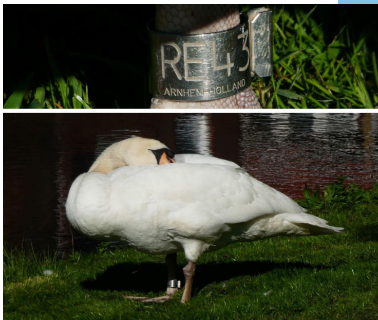
Figuur 2: De geringde zwaan en een close-up van het nummer, 1 augustus 2019.

De vriend van Arild, Kare Skarsvaag, had RE43 namelijk afgelezen op 1 augustus 2019 en de ring mooi gefotografeerd waardoor er geen twijfel is over de code. De vogel was ogenschijnlijk gezond gezien bij Kalvåg in Noorwegen! Dat is hemelsbreed een afstand