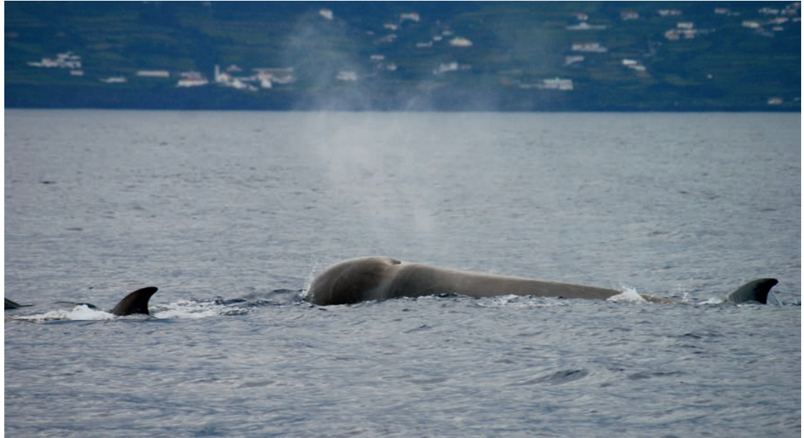
Butskoppen. Bottlenose whales.