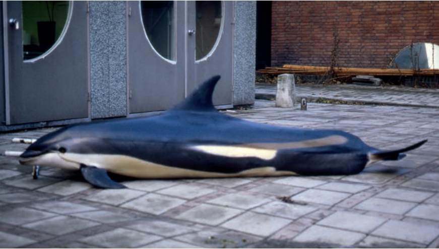
▲ Witflankdolfijn, mannetje, gestrand bij Sint Maartenszee op 28 november 1985. White-sided dolphin, male, stranded at Sint Maartenszee on 28 November 1985.

40 witsnuitdolfijnen (HAASE 1987). Er zijn twee andere, zij het onbevestigde, waarnemingen in het Nederlandse deel van de Noordzee vanuit een vliegtuig: 7 december 1982 op 54°57'NB 03°25'OL en 7 maart 1986 op 53°59'NB 04°17'OL (BAPTIST 1987).