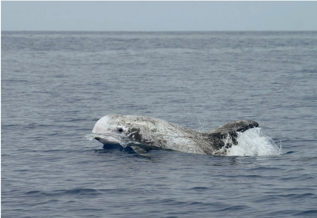
◀ Gramper. Risso's dolphin.

Probable range in the northern Atlantic Ocean; vagrant in the North Sea.