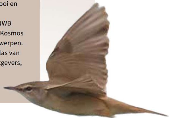
Grote Karekiet, Eempolders 2019