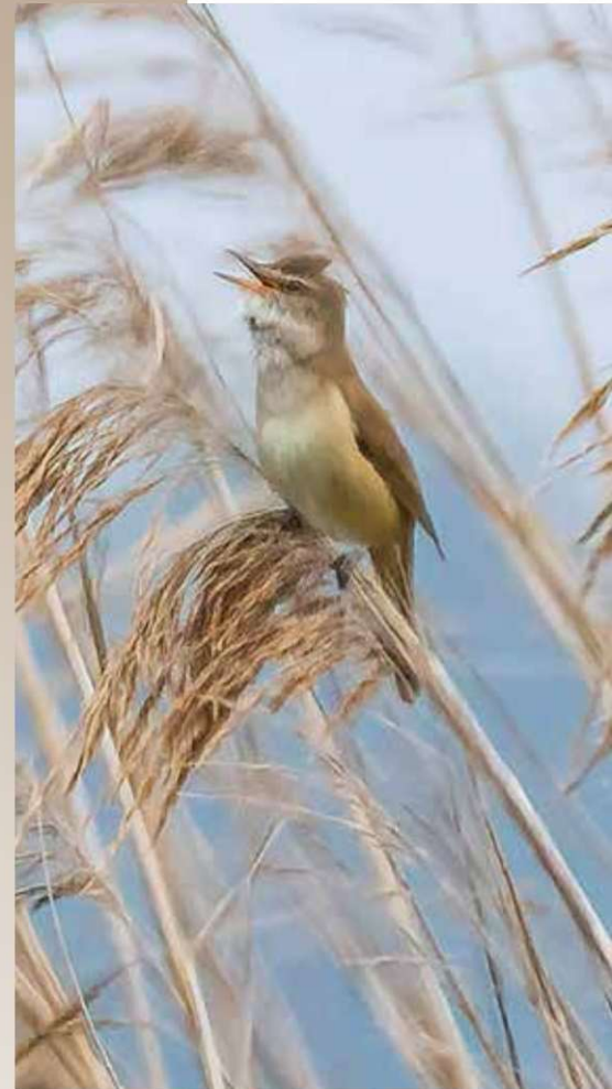
Grote Karekiet Gooimeer, mei 2023