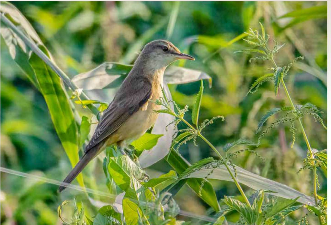
Grote Karekiet, Gooimeer, mei 2023 | Iwan Vermeij