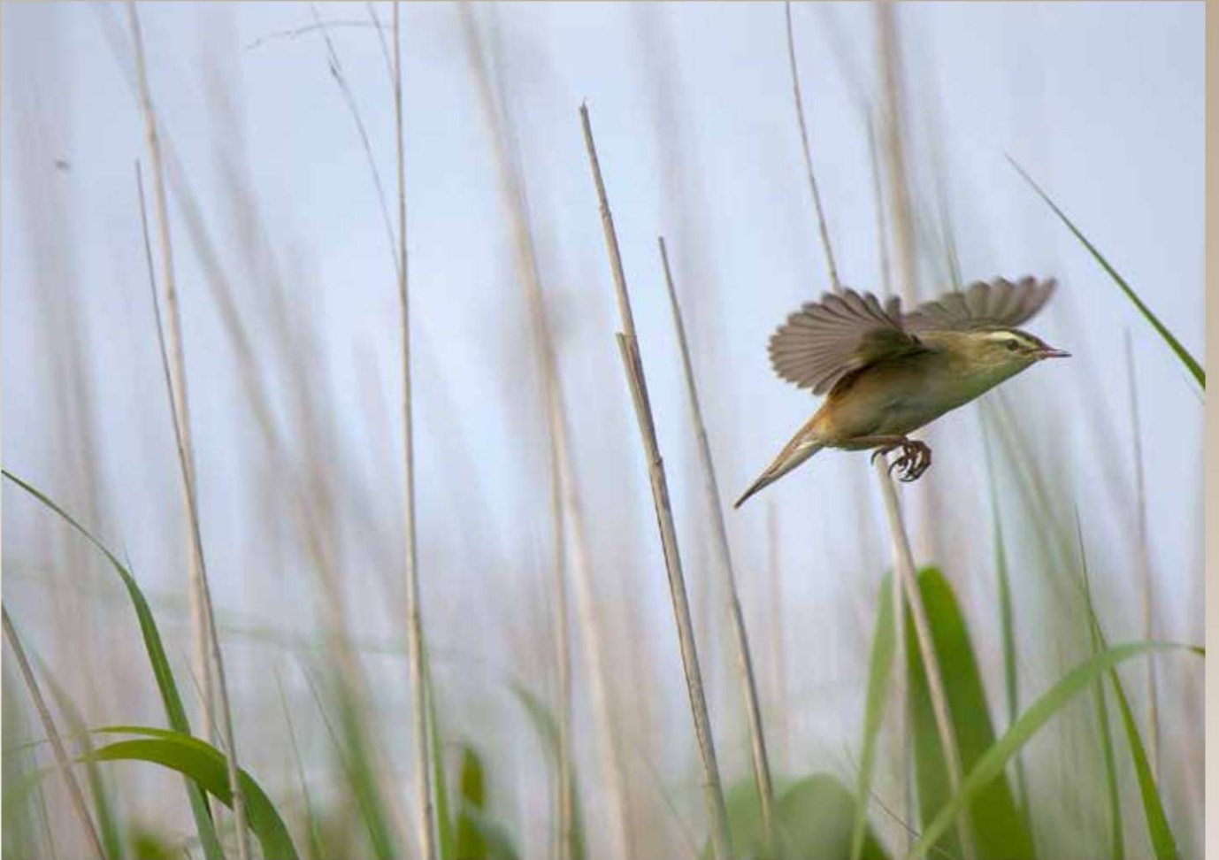
Grote Karekiet, Groene Jonker, juni 2023