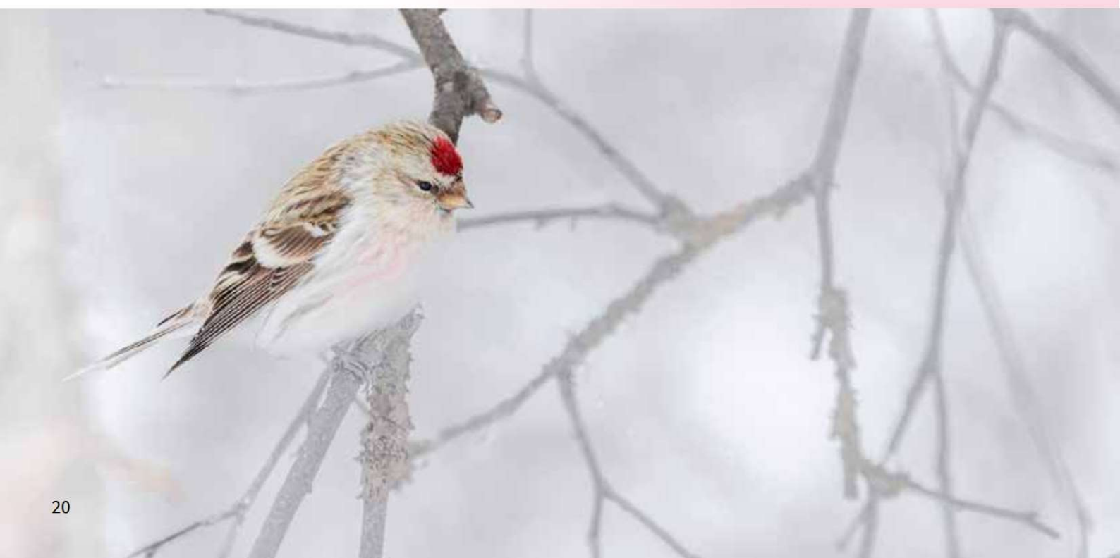
In de zomer vind je de Grote Barmsijs in het Noorden - Varanger (Finland) maart 2023

Grote Barmsijsen worden in het Gooi vooral gezien in de maanden december en januari, in mindere aantallen in de maanden november en februari - maart. Recentelijk zijn de grootste aantallen gezien rond de Machine bij het Naardermeer.