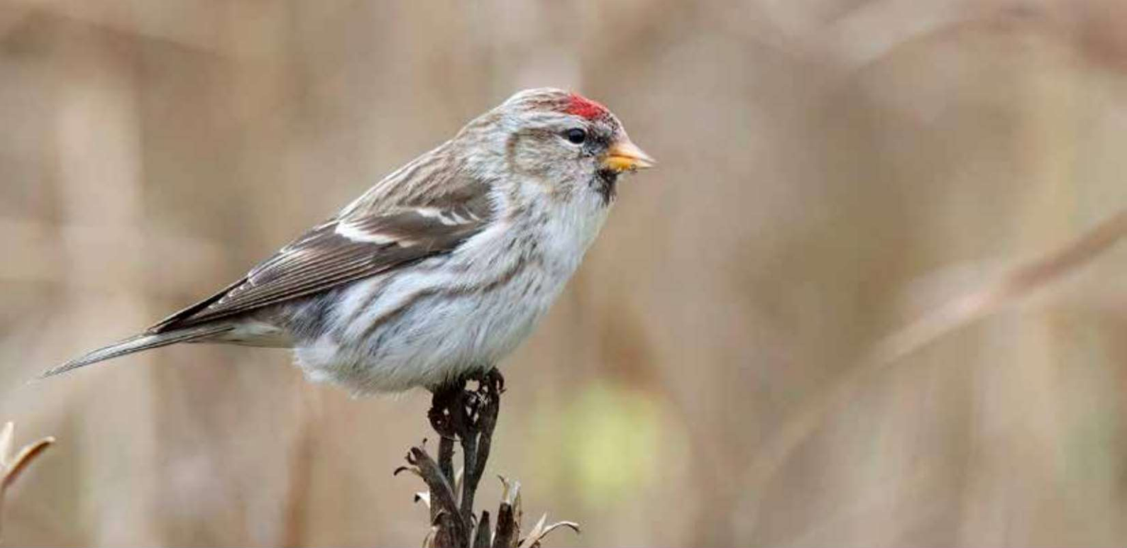
Grote Barmsijs in het Stadspark in Huizen januari 2024 | Jurriën Uiterwijk