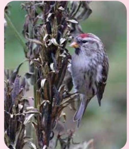
Grote Barmsijzen in het Stadspark in Huizen januari 2024 | Jurriën Uiterwijk

Deze winter worden we getraakteerd op een invasie van Grote Barmsijzen in Nederland en ook het Gooi. Enkele extreme koudegolven in Noord-Europa, met temperaturen onder de min 40° C in Zweden, dwingen noordelijke soorten om hun heil te zoeken in het zachtere zuiden. Zo ook de Grote Barmsijzen.