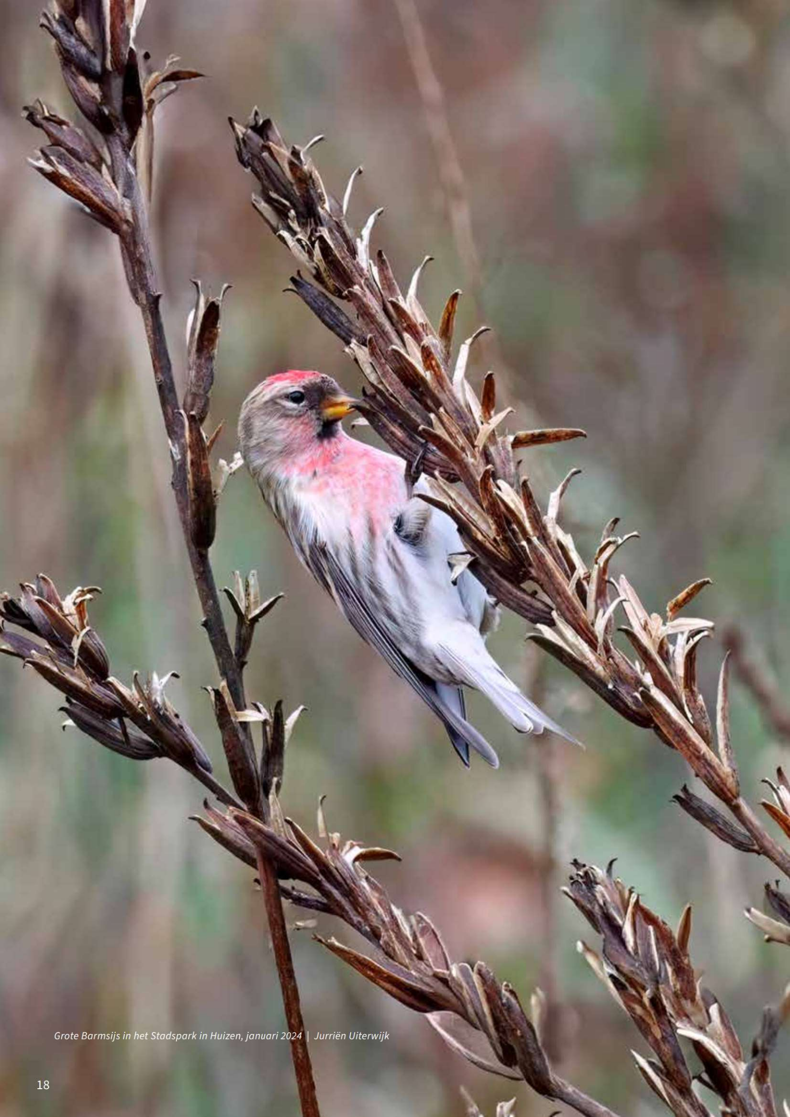
Grote Barmse in het Stadspark in Huizen, januari 2024 | Jurriën Uiterwijk