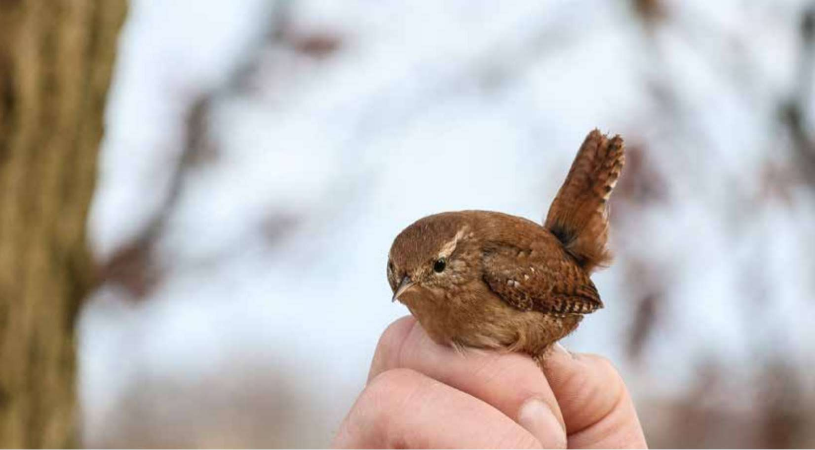
Om hem goed te kunnen bestuderen, wordt deze Winterkoning vakkundig vastgehouden - Vogelringstation Gooimeer, 03-03-2024