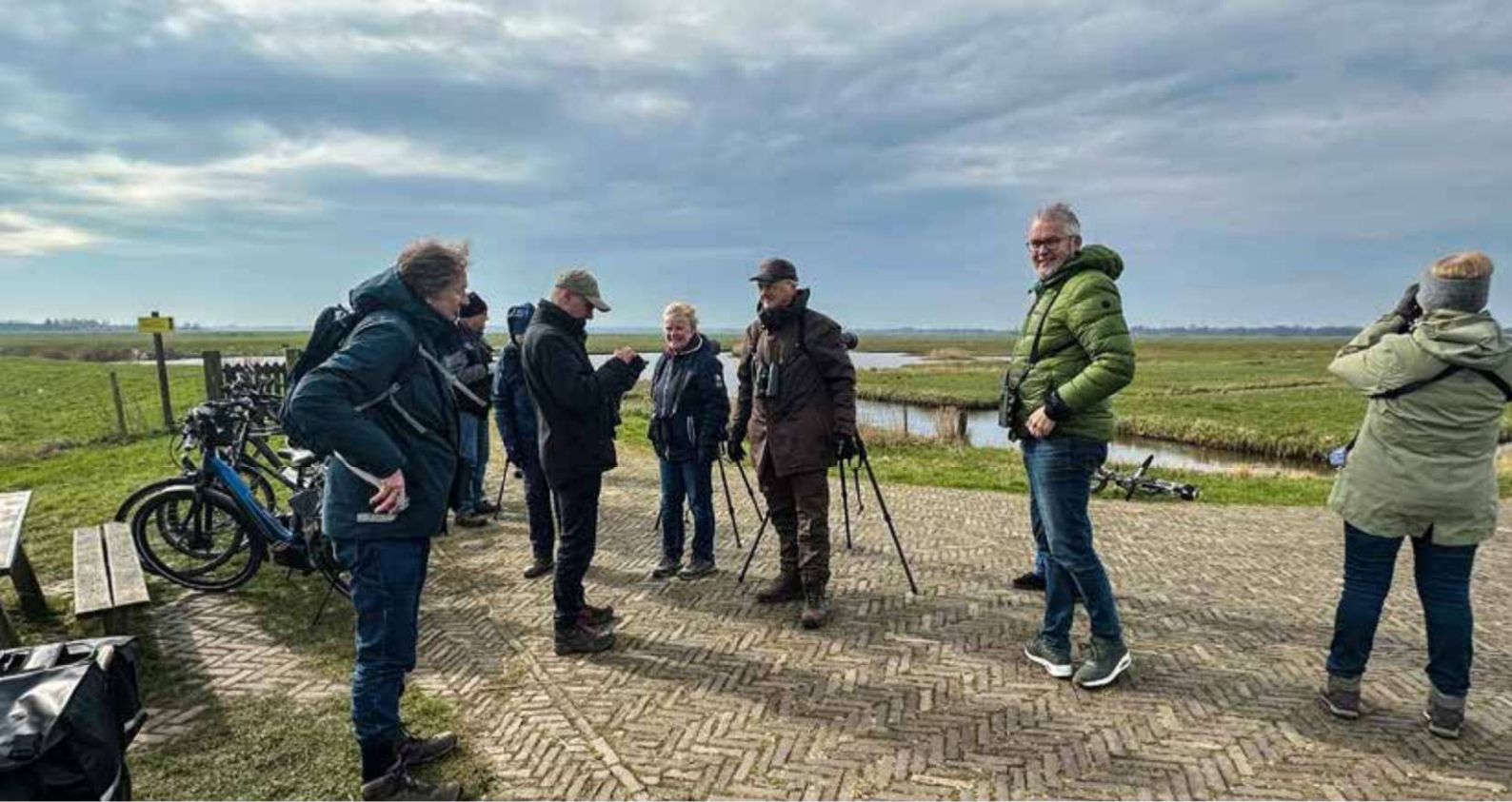
Fietsexcursie, Eempolder 10-03-2024

aandachtige blik: een Velduil. Hij laat zich helaas maar kort zien en duikt het veld in om zich onzichtbaar te maken.