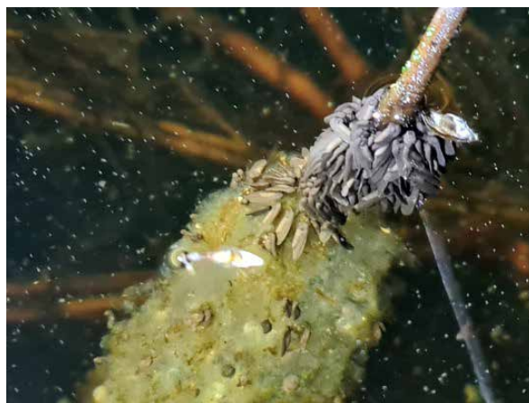
Het stadium na het uitkomen van de larven waarbij deze zich verzamelen boven het eisnoer.

Wil je meer weten over de zeldzame knoflookpad kijk dan eens op de site van RAVON: