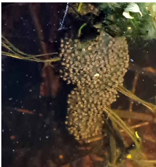
Een eisnoer van knoflookpad waarbij de eieren naar de buitenkant zijn verhuisd. Opvallend is de grijzige kleur. Deze grijze kleur wordt veroorzaakt door de groei van de larven die in het eisnoer zichtbaar zijn. Naarmate de larven groeien, worden ze egaal grijs, bruin tot blauwzwart.

Hierbij een aantal foto's met een korte uitleg; de foto's zijn van Jöran Janse van RAVON.