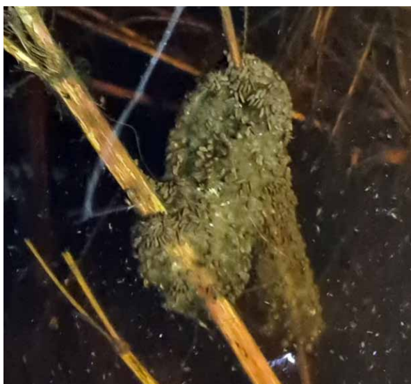
Een eisnoer waarbij veel larfjes te zien zijn.