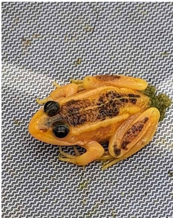
De jonge groene kikker met kleurafwijking, augustus 2023.