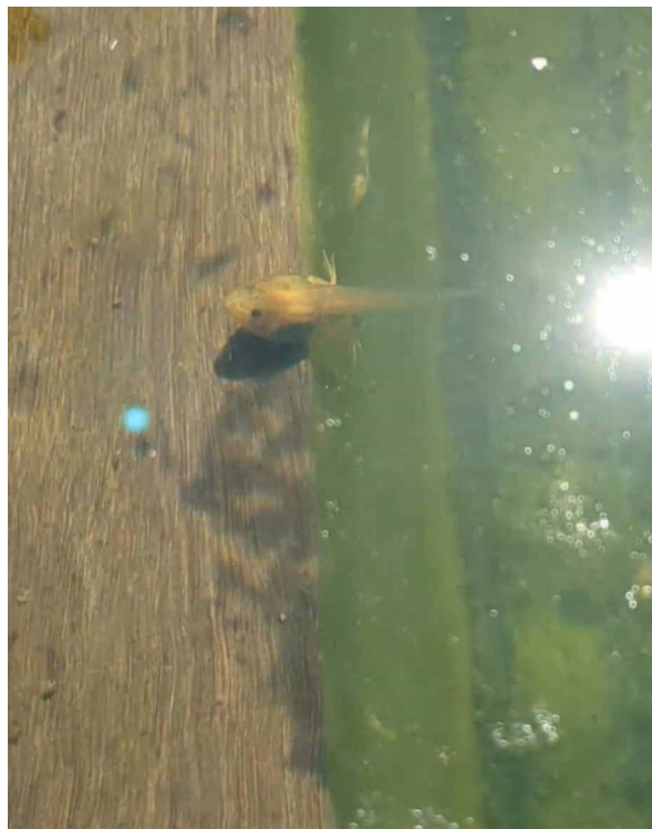
De donderkop met kleurafwijking, juli 2023.