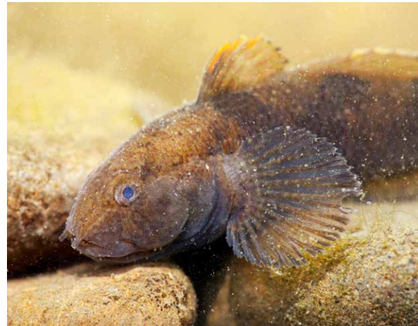
De marmelgrondel was in 2002 de eerste exotische grondel die Nederland bereikte.

De herkenningkaart wordt meegestuurd met deze Schubben & Slijm nr 57. Daarnaast zal deze tijdens lezingendagen beschikbaar zijn in onze stand. De herkenningkaart is ook te downloaden via www.ravon.nl/Herkenningkaarten .