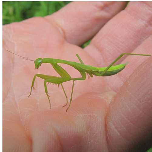
Figuur 2. Waarschijnlijk een juveniel van Iris oratoria , Beek (Gelderland), 4.IX.2009.

Figure 1. Male Iris oratoria , America (province of Limburg), 4.IV.2024.