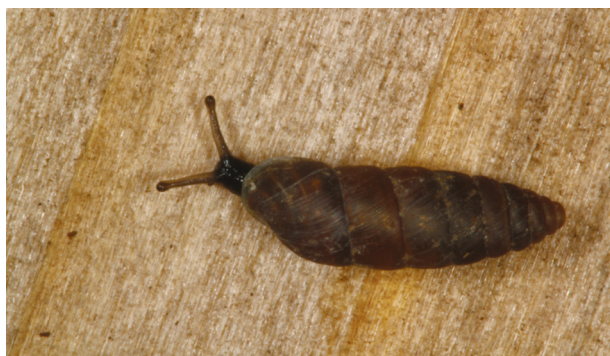
Fig. 5. Korenkorrel Abida secale van site Maréchal, Lanaye (B).

Deze derde plaats was het natuurgebied in ontwikkeling op het terrein van de Eerste Nederlandse Cement Industrie (ENCI). De bedoeling was om de vijver te bemonsteren, wat ook is gebeurd.