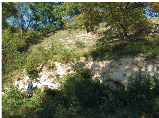
Fig. 4. Site Maréchal, Lanaye (B).

In tabel 1 zijn de vondsten van de verschillende locaties waar landslakken zijn gevonden opgenomen. In totaal zijn er 40 soorten landmollusken gevonden, waaronder 7 soorten naaktslakken.