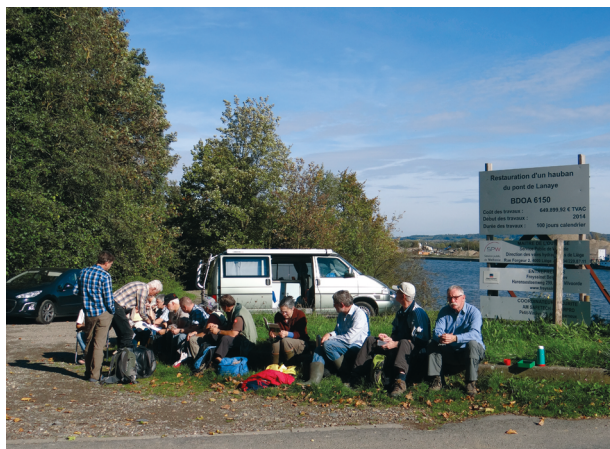
Fig. 1. De NMV/MSL deelnemers.

Op zaterdag 18 oktober hebben 27 personen deelgenomen, deze zijn lid van een of meerdere van de volgende 'schelpengroepen' (fig. 1 en 2):