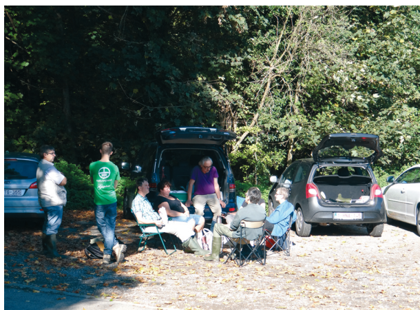
Fig. 2. De BVC deelnemers.