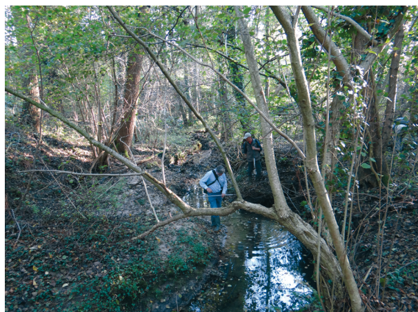
Fig. 10. Bert Jansen en Stef Keulen in het dal van de Gaesbeek, Reuver.

gevonden: de Gemaskerde erwtenmossel Pisidium personatum Malm, 1855. Aart was de eerste die deze soort vond. In de begroeiing langs de beek met veel drassig plekken zijn onder hout en in holtes van bomen verschillende soorten landslakken gevonden. Ook is er gekeken bij de plek waar de Gaesbeek uitmond in de Schellekensbeek.