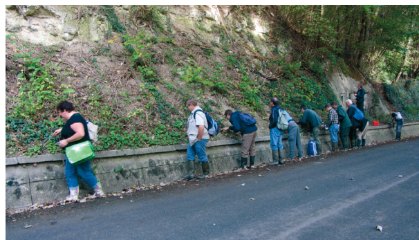
Fig. 2. Zoeken langs de Rue du Garage, Lanaye (B).

De eerste plaats in Lanaye die werd bemonsterd was vanaf de parkeergelegenheid vlak na de brug over de Maas langs de weg omhoog naar het natuurgebied Montagne Saint-Pierre (fig. 3). Later was zo te zien dat men op Belgisch grondgebied is. In tegenstelling tot in Nederland zijn de ingangen van de 'grotten' in de mergelrots op de 'site Maréchal' niet afgesloten met een hek (fig. 4). Voor de Nederlandse deelnemers is dit een aardig gebied omdat hier de Korenkorrel Abida secale (Draparnaud, 1801) leeft, terwijl deze soort niet voorkomt op het Nederlandse deel van de Sint-Pietersberg of elders in Nederland (fig. 5). Opvallend was ook het veelvuldig voorkomen van een relatieve nieuwkomer in de fauna: de Gekielde loofslak Hygromia cinctella (Draparnaud, 1801) die hier vooral op brandnetels leeft. Naast de mollusken is het altijd leuk en boeiend om andere zaken te zien, zoals verschillende soorten paddenstoelen, insecten en zelfs een Hazelworm Anguis fragilis (fig. 6).