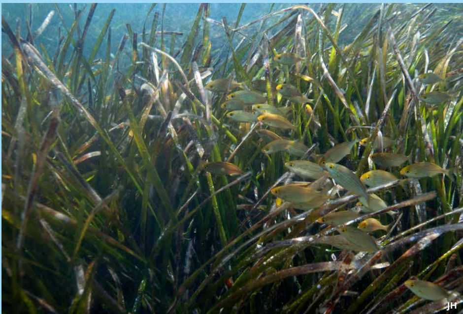
Gestreepte bokvis in een zeegrasveld.